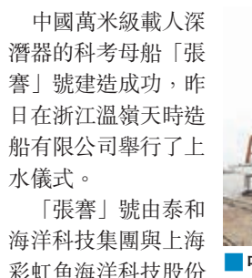
■中國萬米級載人深潛器科考母船「張謇」號成功建造。

中國萬米級載人深潛器的科考母船「張謇」號建造成功,昨日在浙江溫嶺天時造船有限公司舉行了下水儀式。「張謇」號由泰和海洋科技集團與上海彩虹海洋科技股份有限公司共同投資建造,船長97米,寬17.8米,設計排水量4,800噸,設計吃水5.65米,巡航速度12節,續航力15,000海里,載員60人,自持能力60天。作為中國萬米級載人深潛器的專用科考母船,「張謇」號今後將配備1台11,000米載人深潛器,1台11,000米無人潛水器,3台11,000米著陸器,以及常規科考船的作業支撐系統。除用於海洋科考外,「張謇」號還具備深海救援打撈、海洋工程設備安裝、檢測與維修、水下考古和電影拍攝、深海探險與觀光等多種功能。 ■新華社