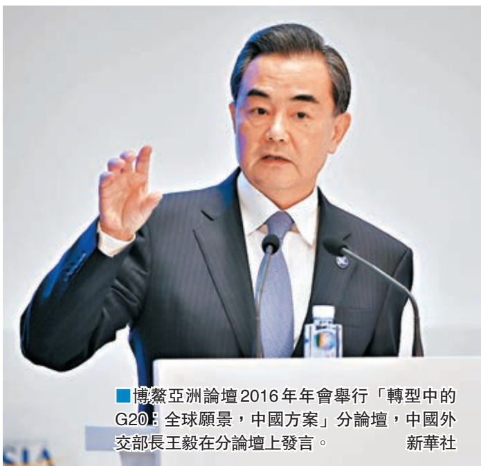
■博鰲亞洲論壇2016年年會舉行「轉型中的G20：全球願景，中國方案」分論壇，中國外交部長王毅在分論壇上發言。

王毅介紹，作為主席國，對於今年G20峰會的成果的考慮如下：首先是把握方向，在當前G20有責任站出來為世界經濟指明方向，既治標謀求眼下的穩增長，也要保增長以謀長遠添動力，在開放中謀求發展共贏，這是世界經濟未來發展的必然的方向。第二是挖掘動力，積極的探索振興世界經濟的新思路，聯合G20其它成員制定一份世界經濟的創新增長新藍圖，並大力促進貿易投資合作，落實2030年可持續發展議程的行動計劃，讓G20先行一步，帶動世界各國實現共同發展。第三是面向行動，承諾一千不如落實一件，我們將努力讓杭州峰會成為「DO SHOP」，而不是「TALK SHOP」，推動G20成員率先的簽署氣候變化的「巴黎協定」，讓巴黎大會的成果盡早得到落實。第四是謀求轉型。王毅認為G20的地位和作用是不可替代的，同時G20也需要與時俱進，逐漸的從一個危機應對的平台向長效治理的機制轉移，希望杭州峰會可以成為G20轉型的一個新起點。