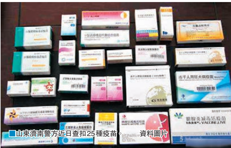
■山東濟南警方近日查扣25種疫苗。 資料圖片