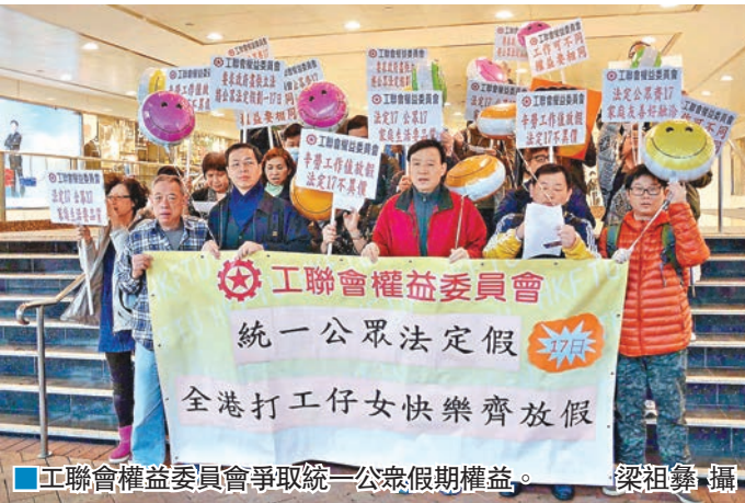
■工聯會權益委員會爭取統一公眾假期權益。

工聯會立法會議員王國興指出，政府近年不斷提倡「家庭友善」政策，卻一邊容許不公平的制度存在，