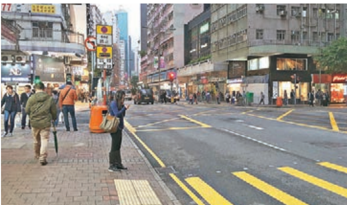
■劉小姐指如今晚上逗留街頭仍然心有餘悸。