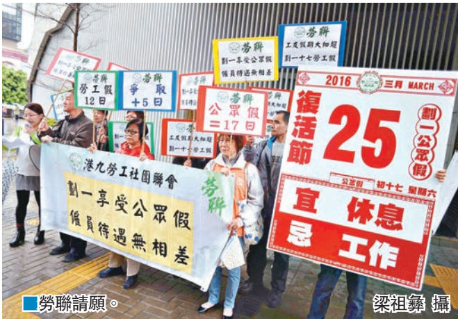
■勞聯請願。

令不少打工仔女在公眾假繼續工作，失去與家人共聚的時間，嚴重影響勞工階層的家庭和諧及精神健康。