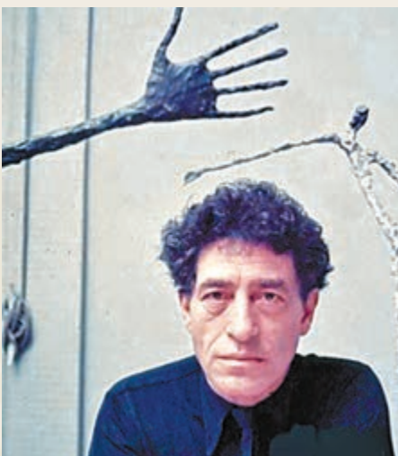
阿爾貝托·賈科梅蒂