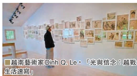
越南藝術家 Dinh Q. Le, 「光與信念：越戰生活速寫」