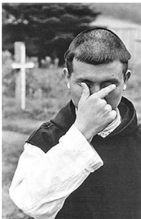
'Garden of Silence' from 'Domains'

展覽資料：香港藝術中心第四屆「收藏家當代藝術藏品展」 日期：即日起至4月10日 時間：10:00 - 20:00 地點：香港藝術中心四至五樓包氏畫廊及大堂 (香港灣仔港灣道二號)