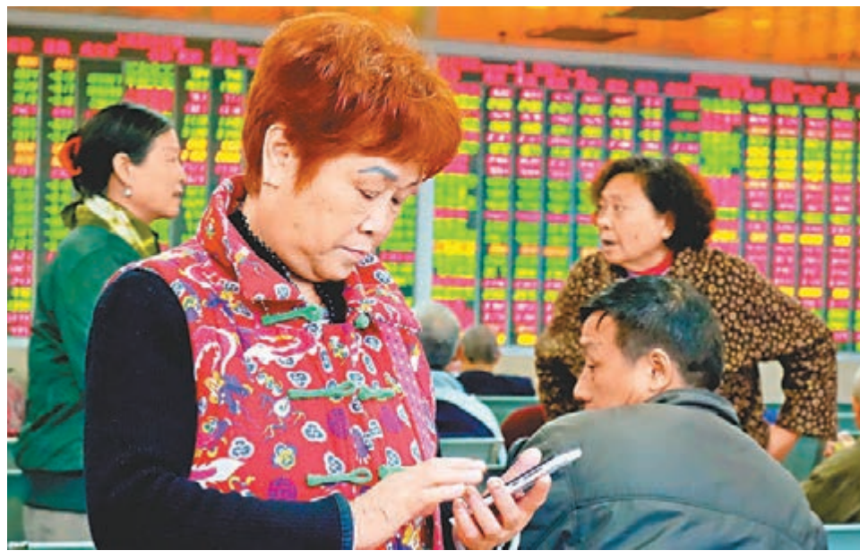
近日滬指連續收陽站上3,000點關口。圖為成都某證券交易大廳內,一股民正在用手機查詢自己的股票情況。

券股尾盤成為護盤主力,個股全部收於紅盤,板塊總體升1.7%。此外,園林工程、軟件服務等概念股漲幅亦居前。船舶製造、貴金屬、民航機場、工程建設、銀行、石油等板塊則收跌,銀行股中僅有工商銀行一股飄紅。