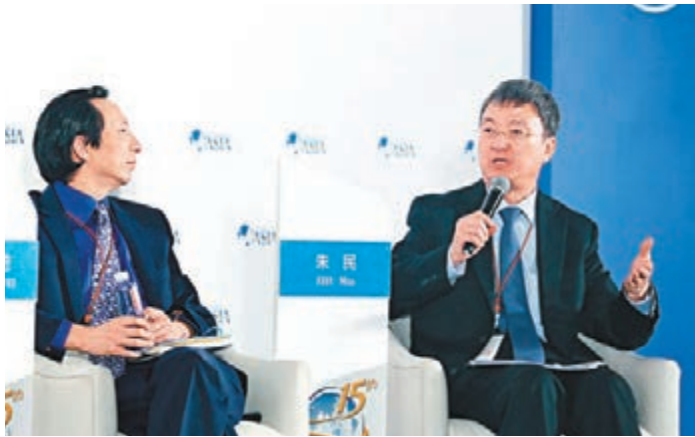
IMF副總裁朱民(右)出席博鰲亞洲論壇2016年年會分論壇,認為亞洲仍是全球最具經濟活力的區域。

香港文匯報訊 受國際大宗商品價格低迷、地緣政治風險上升、金融市場波動、自身缺乏新的增長點等影響,曾經被視為全球經濟增長火車頭的亞洲,目前正陷入經濟放緩。不過,在正在海南省舉行的博鰲亞洲論壇上,經濟界對亞洲未來仍然看好。