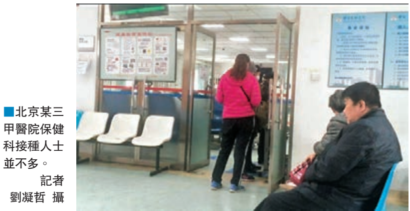
北京三甲醫院保健科接種人士並不多。