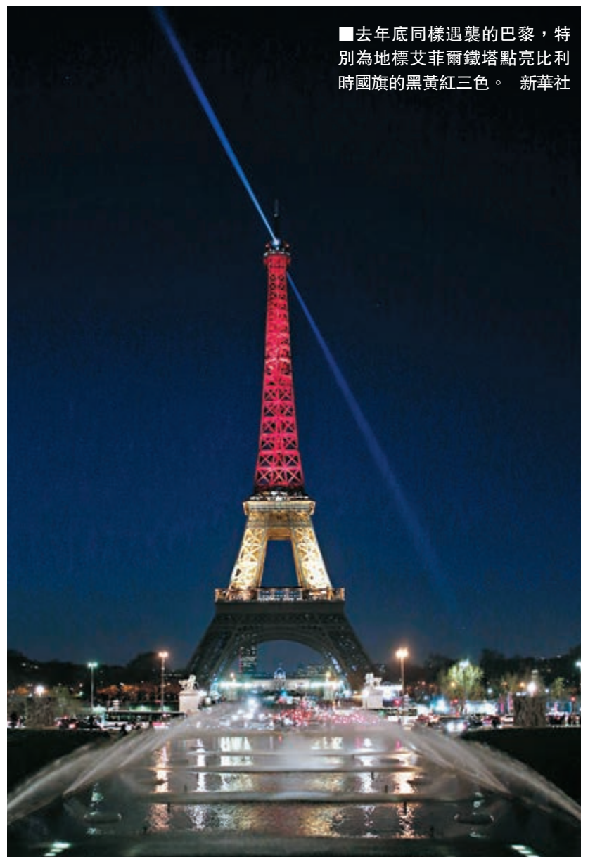
去年底同樣遇襲的巴黎，特別為地標艾非爾鐵塔點亮比利時國旗的黑黃紅三色。

作為歐盟總部所在地，籠罩比利時的恐襲陰霾多年來揮之不去。自2012年8月以來，至少450名比利時人前往敘利亞，加入「伊斯蘭國」(ISIS)或「努斯拉陣線」等恐怖組織，按人口比例計冠絕西歐。當中至少100人已返國，加上眾多從未離境、「遙距激進化」的極端分子，持續威脅着比利時國家及國民性命安全。