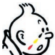
比利時著名漫畫《丁丁歷險記》的主角因為恐襲而流淚。

比利時近年淪為恐怖活動溫床，除了出現巴黎恐襲主謀阿巴烏德等本土土長的極端分子，比利時也常被恐怖組織用作籌集資金、調動武器的「物流中心」。布魯塞爾遇襲，再次揭示比利時情報機關反恐不力，甚至被批評是「歐洲最弱一環」。土耳其總統埃爾多安昨日稱，土耳其去年6月在接壤敘利亞邊境的南部地區，扣留今次布魯塞爾恐襲的其中一名兇徒，其後將他遣返比利時，並警告比國當局他是一名「外國恐怖主義戰士」。但比利時未能確定他涉及恐怖主義而釋放他。埃爾多安沒透露該名兇徒的身份。