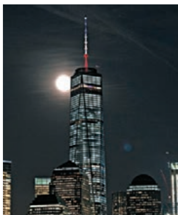
紐約世貿中心大樓頂部點亮黑黃紅三色，但燈光在鏡頭下離奇變成法國國旗的藍白紅。