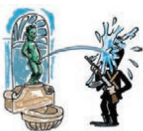
有網民以比利時著名雕像「撒尿小童」製作改圖，讓小童尿在恐怖分子的頭上。