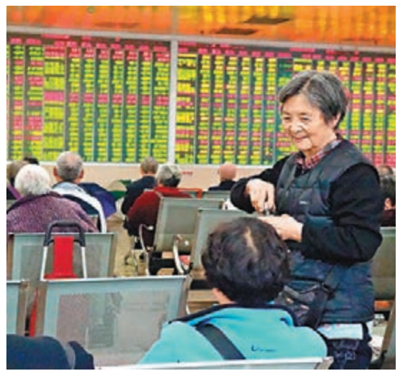
滬深股市在連續數日上漲後出現調整。滬綜指昨收報2,999點,跌0.64%。中新社

香港文匯報訊(記者 章蕙蘭 上海報道)A股周一收復3,000點後未能再下一城,昨日陷入盤整走勢,失守3,000點整數關口,止步七連陽。深成指與創業板指亦分別小幅下挫0.48%和0.24%。