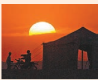
球迷可體驗沙漠露營。

年世界盃足球賽決賽周時最多也只能提供約4.6萬間房，低於國際足協要求的6萬間。有報道指，卡塔爾方面可能會在世盃時安排一些球迷住進郵輪客房，甚至在沙漠露營「酬賓」。專家指，比賽時間為11至12月的冬季，是沙漠露營旺季，是解決住房不足的可行方法。 ■香港文匯報記者 梁志達