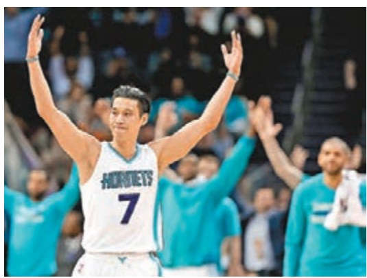
林書豪慶祝贏球。

此外，美國女權運動作家艾麗希絲近日開車在荷里活某路上停紅燈時，身旁吉普車上的壯漢竟朝她的68歲母親做出不雅動作，她母親受驚並哭起