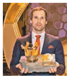
施治再奪捷克最佳殊榮。

為捷克國足把關14年、憑去夏轉會阿仙奴後的佳態準備出戰今夏歐國盃的33歲「鋼門」施治，昨當選為捷克年度最佳球員，之前他七膺「捷足先生」，上次是2014年。另早前因賭錢後遭失銀包遭德甲屬會不夫斯堡罰款的28歲中場麥斯古斯，暫遭德國隊除名。