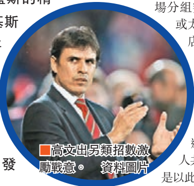
高文出另類招激發鬥戰意。

威爾斯國足首次躋身歐洲國家盃決賽周，球迷很期待當家球星加里夫巴利跟艾朗藍斯精彩演出。威足主帥基斯高文昨透露，今夏將禁止球員的太太、女友(WAGs)隨隊赴法國，但假如入到16強，即可解禁一天跟女伴共聚，被指變相以此來激發爭勝鬥心。