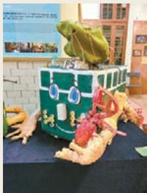
■ 藝術化的電車模型。