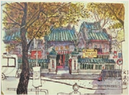
■ 學生筆繪下的文武廟。