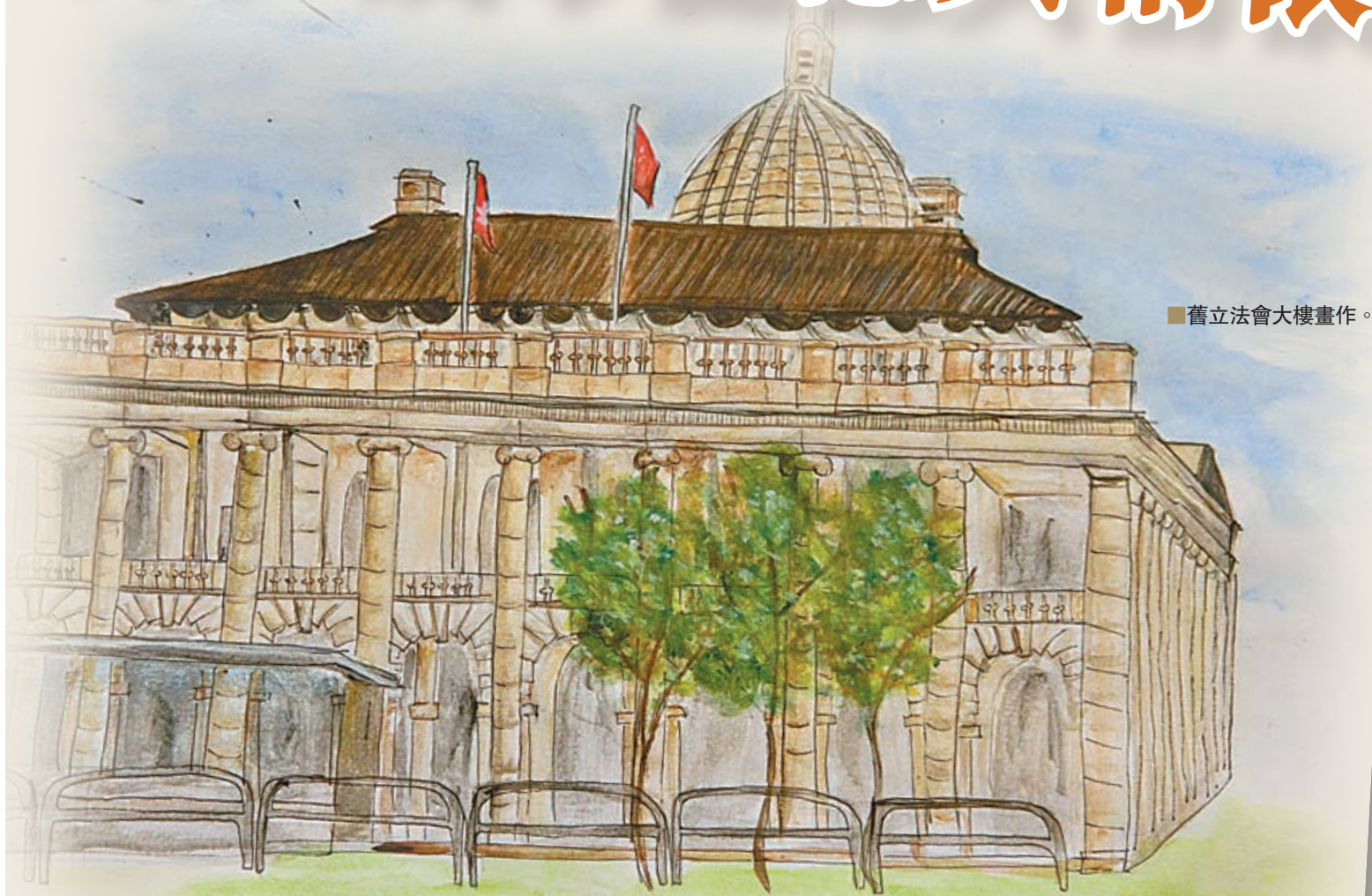
■ 舊立法會大樓畫作。

香港十八區各種景致，都能講出一個頗具在地情懷的故事。如何讓這些景致一直留在香港人的心中，則是描刻香港歷史記憶的一項重要工程。長春社文化古蹟資源中心(CACHe)得以為香港電台製作及推出的紀錄片《香港歷史系列》設計一系列延伸體驗學習活動，協助學生以不同層面探索過去。透過講座、工作坊、導賞、繪畫等知識交流體驗，啟發學生對香港這城市歷史的情感，身體力行尋找歷史的足跡。