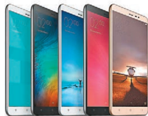
紅米 Note3有銀白色、金色、深灰色三種顏色。右圖為小米副總裁Hugo Barra。