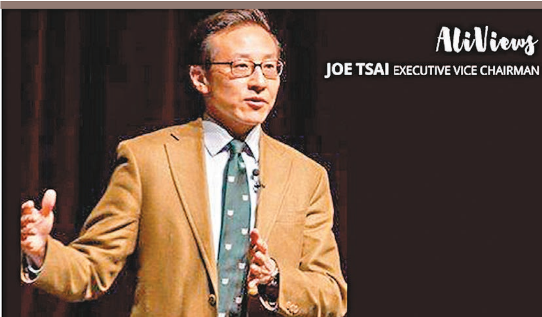
阿里集團副主席蔡崇信認為，GMV在衡量該公司成功方面的重要性已經降低。