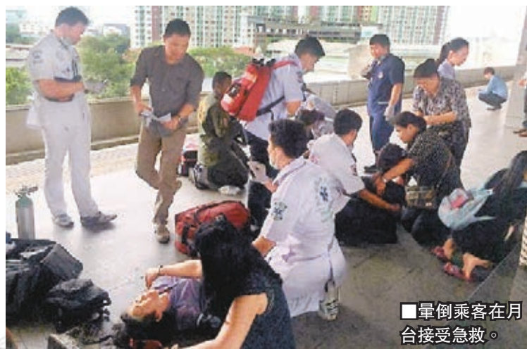
暈倒乘客在月台接受急救。

許多旅客和民衆使用的泰國曼谷機場鐵路，近期接連發生故障甚至暫停服務，昨早繁忙時間更停電，約750名乘客被困車廂逾兩小時，由於日間氣溫高達攝氏35度，旅客擠在悶熱車廂內，至少7人中暑暈倒，幸好經急救後沒大礙。社交網站流傳的圖片顯示，至少50名乘客打開逃生門走出車廂外，沿路軌走到最近車站。