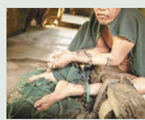
印尼1977年起禁止對精神病者使用鐐銬，但至今仍有不少病人受此殘酷對待。國際人權組織「人權觀察」(HRW)最新報告顯示，印尼現在仍有近1.9萬名精神病患者被鐐銬鎖着(見圖)，活於籠牢之中，恍如「人間煉獄」。報告促請當局關注患者需要，並加強監管精神病院，取締鐐銬。

報告稱印尼政府對精神病患者長期缺乏關注，病者家屬知識水平亦偏低，部分甚至以為病人是「遭人下咒」，遂以鐐銬鎖着，形容禁令形同虛設。 ■《衛報》/法新社