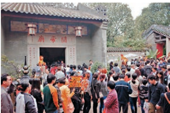
民眾爭相排隊在許願池洗手。

南海神廟的廟會是一種古老的漢族民俗及民間宗教文化活動。在每年農曆二月十一至十三舉行，其中十三為正誕，即「南海神誕」，也叫「波羅誕」，是廣東省廣州市乃至珠江三角洲地區最大的民間廟會，也是現今全國唯一對海神進行祭祀的活動。