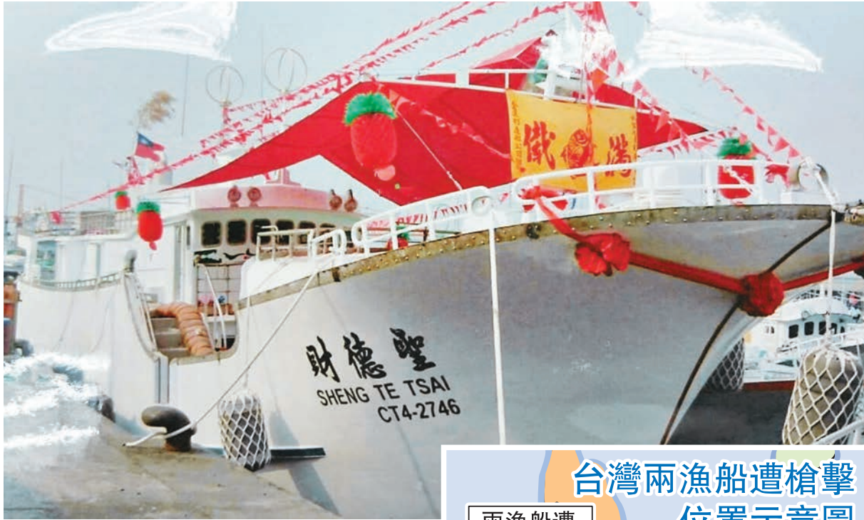
■ 台兩漁船在馬六甲海峽疑遭印尼巡邏船槍擊，幸兩船及時逃脫，人員平安。圖為「聖德財號」。

印尼水域，北邊是馬來西亞水域，往西是印度水域，但也是國際航線，正常行駛時，不時會遭過境攻擊；由於過去曾向印尼詢問過類似情況，印尼官方否認，告知當時無公務船在相關水域執法；因此這次是否為印尼軍方所為，或是海盜所為，須經由「外交部」正式向印尼政府確認。