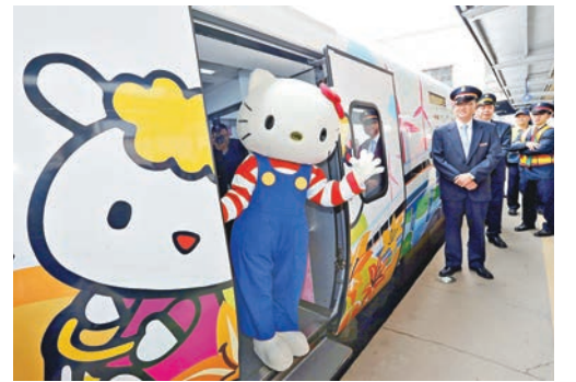
■ 台灣首列Hello Kitty彩繪火車亮相。

據悉，野生動物保育法修正草案「立法院」若於本會期審議通過，最快可望今年底、明年初實施。李桃生表示，該法通過後，台灣可能是華人世界首個放生要許可的地區。