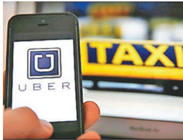
■ 台灣加重Uber罰則。昨日起，6個月內2次違規，將可重罰約2.4萬港元，並吊扣牌照半年。

Uber目前在台灣仍存在繳稅與保險的法律問題，也有民眾反映曾因為將信用卡綁定到Uber賬戶而被盜刷車費。有台北的Uber司機曾表示，被開罰單公司會幫忙繳罰款，甚至不用自己跑繁複的行政手續，對於此前的吊銷車牌處罰也