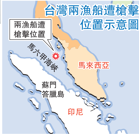
台灣兩漁船遭槍擊位置示意圖

他補充，馬六甲海峽也有海盜，但不像索馬里海盜般具備組織戰力，多數只會對小船下手，未聞台灣大船行經時被攻擊；本次事件的2艘台灣漁船都是小船，不排除因此被海盜攻擊；預計2天半後，將抵達新加坡，屆時新加坡駐外代表處會與船方訪談了解。