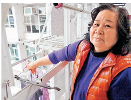
居民投訴「直置式」晾衣架「一張床單都晾唔到」。