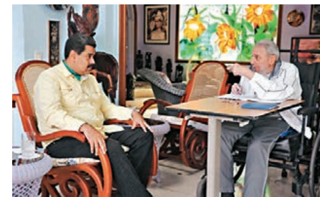
卡斯特羅(右)前日接見到訪的委內瑞拉總統馬杜羅，展示兩國友好。