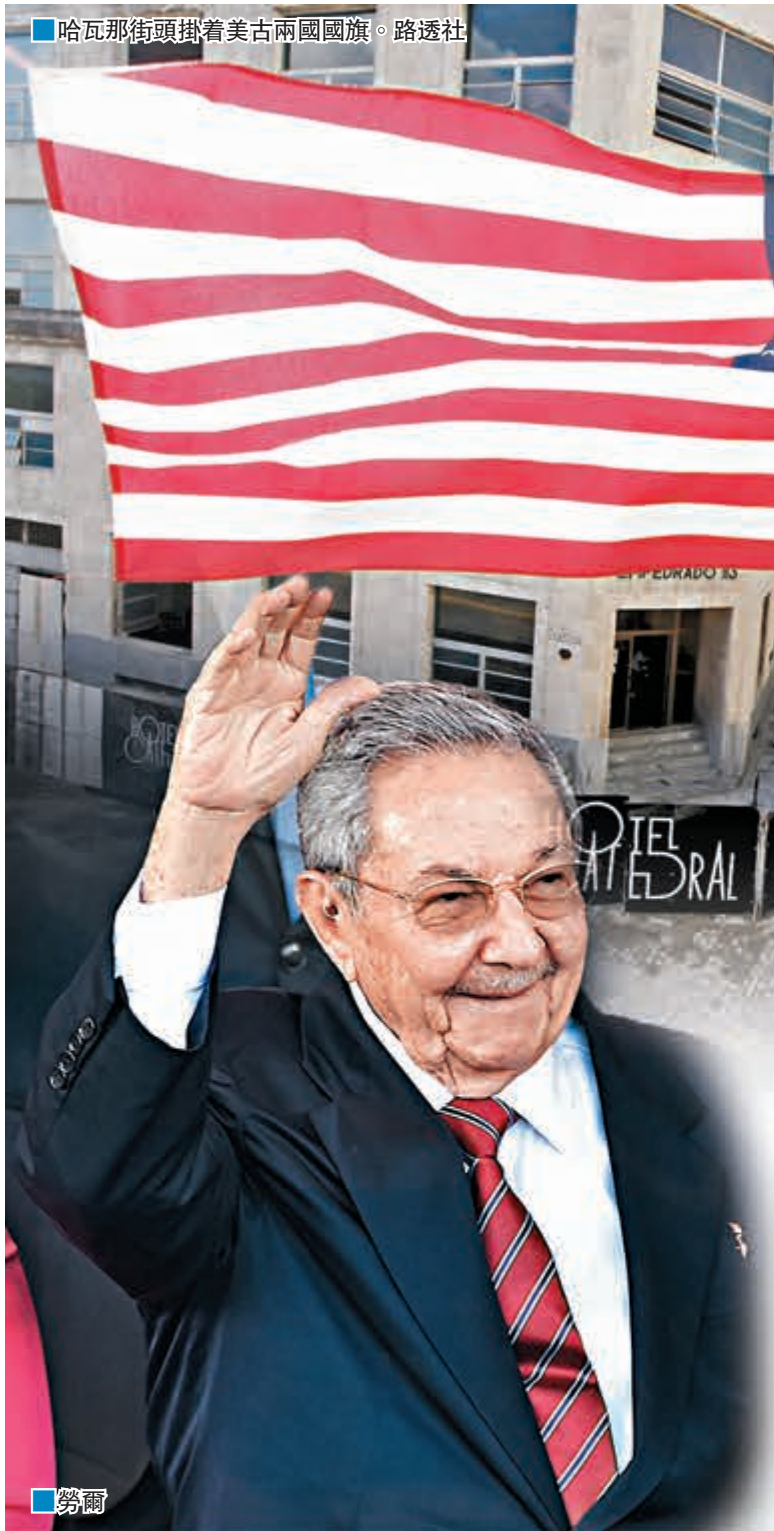
哈瓦那街頭掛着美古兩國國旗。