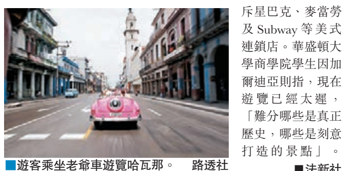
遊客乘坐老爺車遊覽哈瓦那。

在美國的經濟封鎖下，古巴多處景物仍然維持1960年代風格，彷彿停留在半世紀前的時空，成為吸引外國遊客一大特色。不過隨着遊客漸增，首都哈瓦那等地漸漸變得商業化及現代化，促使不少人趕赴當地，抓緊機會遊覽「舊古巴」。古巴電影製作人利亞諾擔心當地會淪為「主題公園」，專供遊客探究歷史。