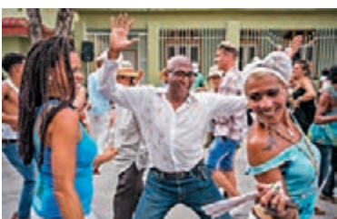
哈瓦那民眾在街頭跳拉丁舞。

美國酒店集團喜達屋酒店及度假村前日宣佈，與古巴簽訂價值數百萬美元的投资協議，營運古巴首都哈瓦那兩間酒店，並與第3間酒店簽訂意向書。這是自1959年古巴革命後，首個美國酒店集團與古巴簽訂投資協議，有助美國總統奧巴馬宣傳美古關係正常化的好處。