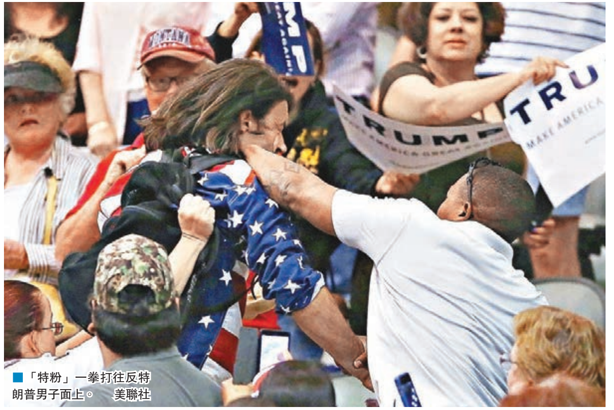
「特粉」一拳打往反特朗普男子面上。

美國共和黨總統初選參選人特朗普氣勢如虹，黨內高層為了阻止他，據報計劃發起「百日運動」，從下月5日舉行的威斯康星州初選開始，動員所有政黨機器，逐一游說各州黨代表不要支持特朗普。一旦計劃失敗，共和黨高層便可能另起爐灶，提名獨立候選人出戰11月的大選，以捍衛共和黨理念，為傳統保守派選民提供不同於特朗普強硬民粹主義的選擇。