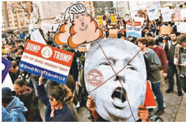
紐約大批倒特示威者上街。