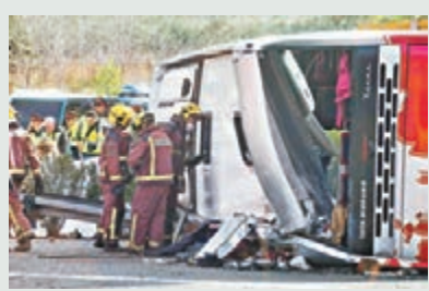
巴士翻側，嚴重損毀。美聯社

學生透過一個交換生計劃入讀巴塞羅那兩所大學，大部分年齡介乎22至29歲，近日到東部城市巴倫西亞參加傳統節慶活動。巴士回程駛至弗雷希納爾斯附近時，撞向右側路障，反彈後撞穿路中央圍欄，再撞向相反方向行車線，撞上一輛汽車，汽車上兩人受傷，巴士最後翻側路邊，車頭完全損毀，當局事後出動吊臂車移離現場。法新社/美聯社/路透社/《星期日郵報》