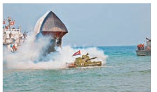
演習旨在防禦韓軍登陸。

朝中社昨日報道，朝鮮軍隊日前進行針對韓軍的登陸及反登陸防禦演習，最高領導人金正恩到場視察。朝中社未透露演習具體日期，但分析認為是本月18日，正好為韓美「關鍵決斷」聯合軍演結束之日。韓聯社