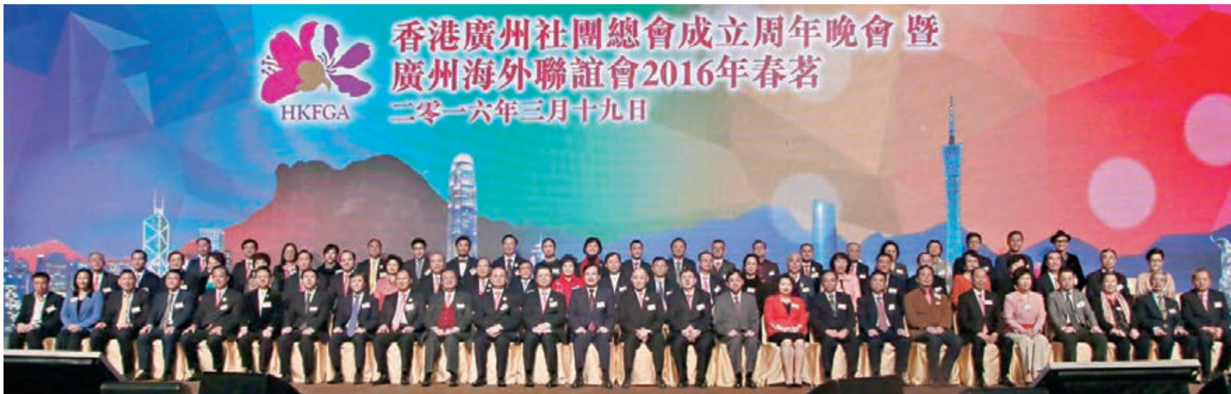
香港廣州社團總會成立一周年晚會暨廣州海外聯誼會2016年春茗，賓主合影。