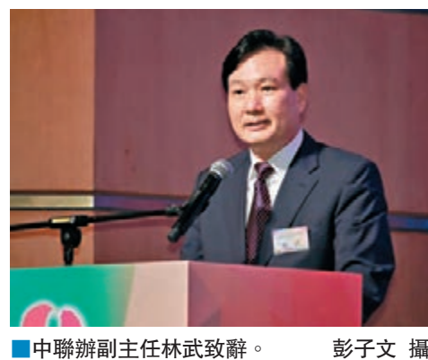
中聯辦副主任林武致辭。

林武表示，該會成立時間雖短，但發展態勢良好，堅定支持特區政府依法施政、維護基本法權威、捍衛國家利益，促進港穗經濟文化交流。在各項社會公益事務中，均能看見該會會員的身影，義工團的青年才俊更是在工餘時間熱心投入公益活動。他相信在霍震寰及黃俊康的帶領下，會務定能蒸蒸日上，影響力不