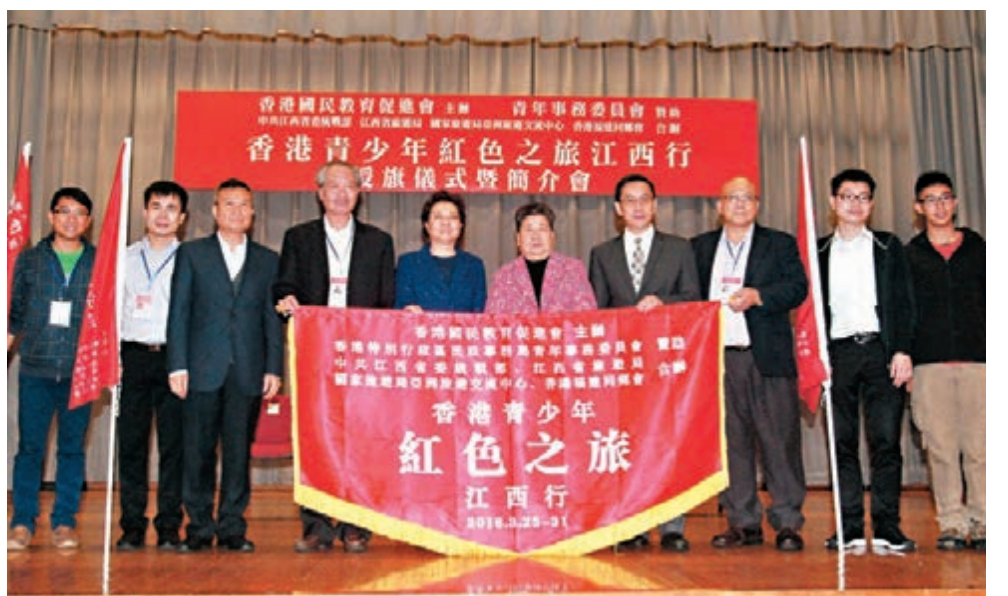
香港青少年紅色之旅江西行舉行授旗禮。