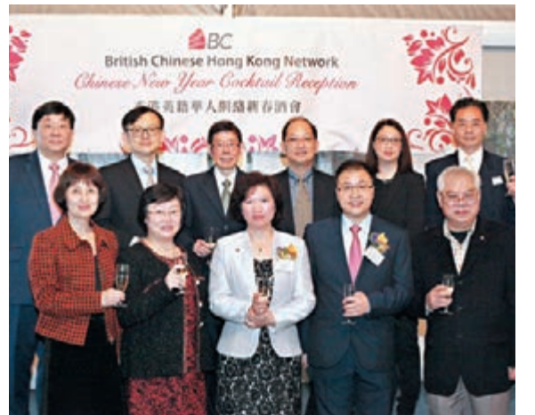
香港英籍華人網絡春茗，賓主祝酒。

香港文匯報訊(記者 子京) 隨着回流香港的居英港人後代陸續增加，一個名為香港英籍華人網絡的新組織正大展拳腳，為回流的海外港人後代提供輔導和協助，使他們重拾「中國心」。香港英籍華人網絡9日在深灣遊艇會舉行新春酒會，中聯辦協調部副部長宋瑋、立法會議員黃定光等嘉賓應邀出席，賓主近百人歡聚一堂，場面喜慶。