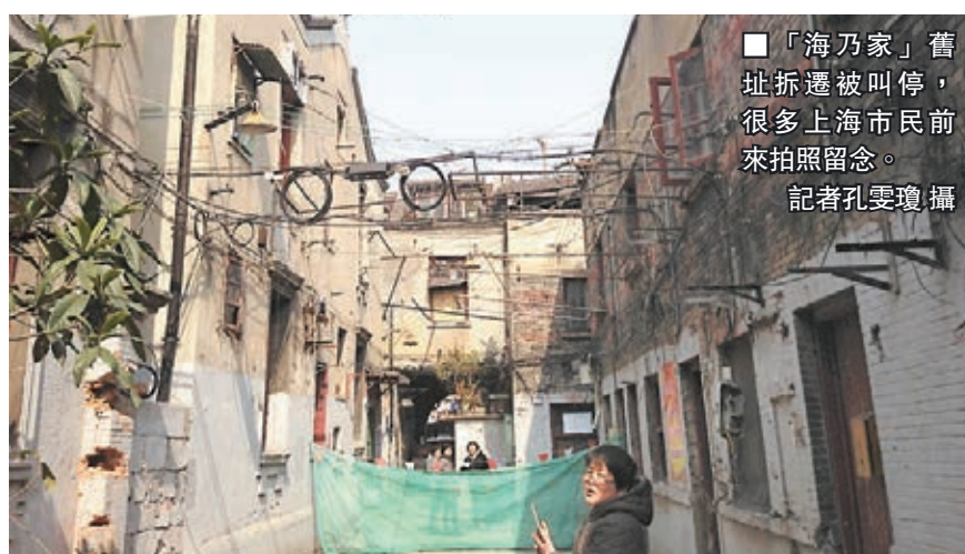
「海乃家」舊址拆遷被叫停，很多上海市民前來拍照留念。