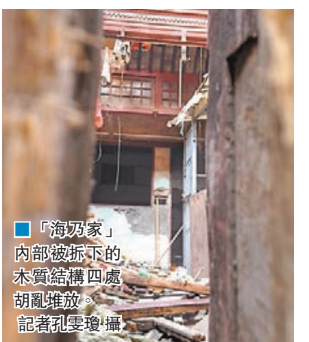
「海乃家」內部被拆下的木質結構四處胡亂堆放。

香港文匯報訊(記者 章蘿蘭、孔雯瓊 上海報道)昔日上海最大的日軍慰安所「海乃家」舊址拆遷被緊急叫停，總算贏得一線生機。但即便被留存，未來可能亦是自生自滅。虹口區政府表示，該建築不具備任何「文物建築」的身份，因此拆除並無不妥。