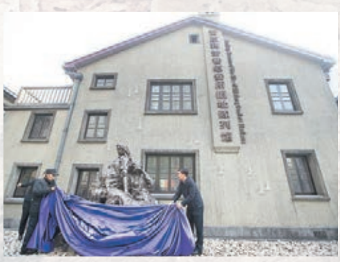
南京利濟巷慰安所舊址陳列館。 資料圖片