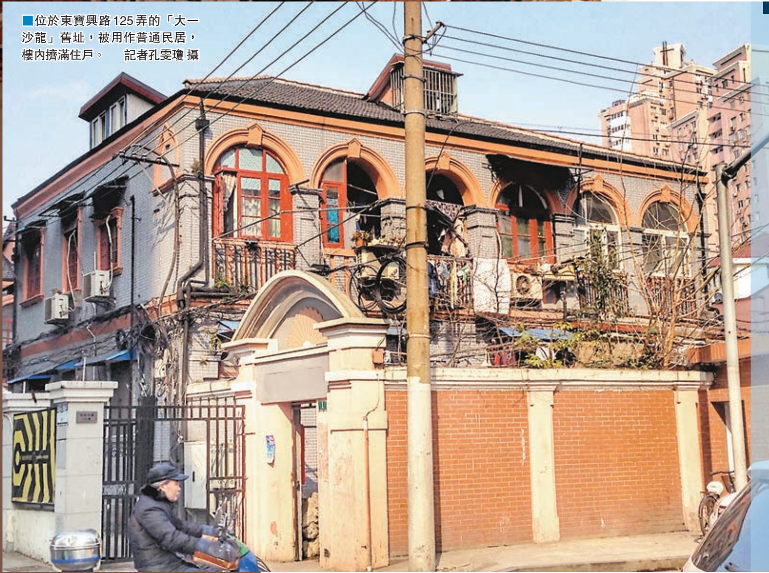
位於東寶興路125弄的「大一沙龍」舊址，被用作普通民居，樓內擠滿住戶。

上海是日軍「慰安所」制度的發源地。世界最早慰安所「大一沙龍」舊址，雖被政府列為「內控」名單，卻未享文物待遇，實際是留而不護。房屋年久失修，內部構造凋零，樓內擠滿住戶，公用部分堆滿雜物，與普通民居並無二致。根據中國「慰安婦」問題研究中心主任蘇智良的最新統計，此間已確認的慰安所舊址原有166個，多數早年即被拆除，淹沒於歷史塵埃中，目前僅留存30餘家，均未被列入文物保護建築。