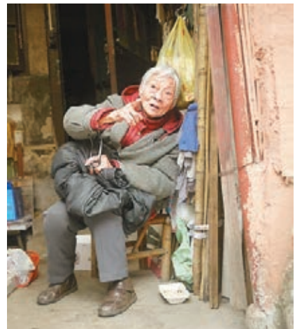
居住在此的多半是耄耋老人，他們向記者抱怨，部分設施已是脆弱不堪。

與其他慰安所舊址一樣，位於東寶興路125弄的「大一沙龍」舊址，亦被用作普通民居，樓內擠滿住戶。記者在現場看到，雖然大牆外立面經過粉刷，內部卻陳舊不堪。走進院落大門，天井內晾衣繩交錯，撲面而來的市井氣息，與建築本身所承載的厚重歷史格格不入。屋內由於缺乏衛浴系統，院落外加建了公共廁所。同時，為了擴大居住面積，還有居民「圈地」搭建違章建築。