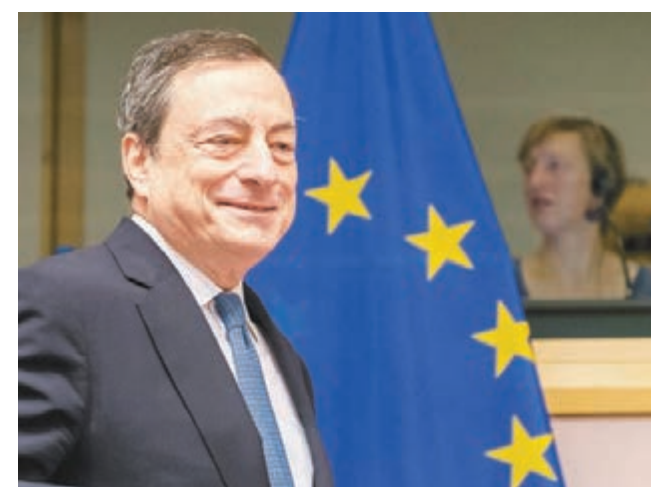
歐洲央行行長德拉吉在3月10日宣佈加碼寬鬆後,歐洲金融市場有正面影響。 資料圖片

低利率或負利率是防止家庭囤積現金的必要措施。在西班牙等周邊國家市場,這是迫使各個