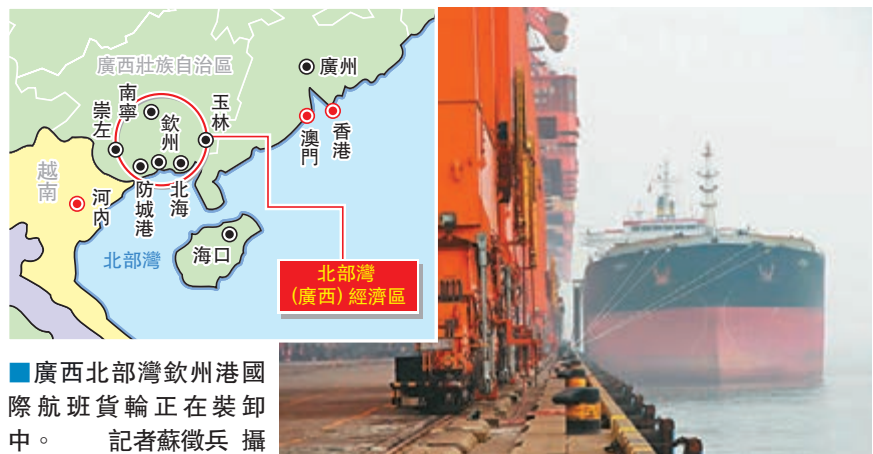
廣西北部灣欽州港國際航班貨輪正在裝卸中。

香港文匯報訊(記者 蘇徵兵 廣西報導)今年是廣西北部灣港區成立10周年。作為西南中南地區對接東南亞、通往東盟、溝通粵港澳最便捷的出海出邊國際大通道,北部灣經濟區吸引港台資本,先後搶灘倉儲物流、五星級酒店、電子信息、旅遊項目開發等產業領域。