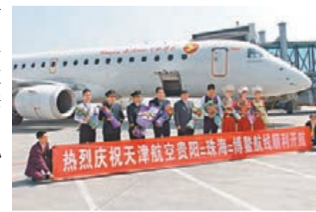
天津航空貴陽-珠海-博鰲往返航線開通現場。

據了解,博鰲機場是博鰲亞洲論壇的重點配套項目,由國家發改委批准立項建設,位於海南省瓊海市中原鎮西側,距瓊海市區12公里,距博鰲國際會議中心15公里。現場一名由貴陽前往博鰲的旅客告訴記者:「以往去博鰲,要到海口轉大巴,現在可直達博鰲了,參觀論壇會址,去海邊遊玩,比以前更方便了。」