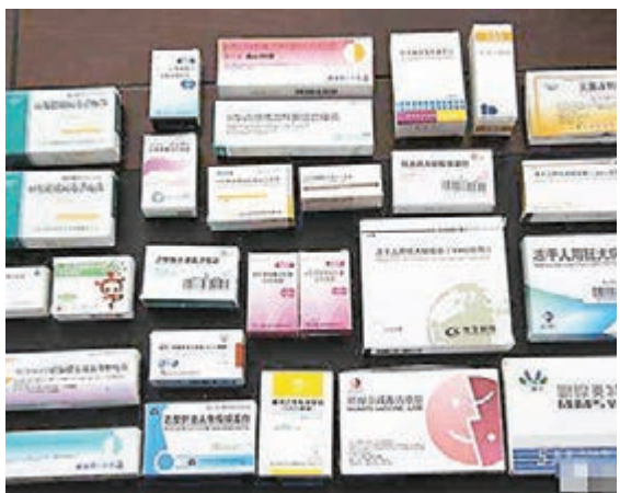
警方在現場查扣疫苗25種。