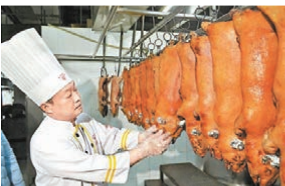
生豬價格上升,料乳豬價格也將上調。 資料圖片

香港文匯報訊(記者 古寧 廣州報導)又到一年清明時,乳豬將會迎來一個銷售高峰。由於豬肉價格比去年有所上升,業界人士則預期,今年清明節乳豬價格將會有所上漲,漲幅在一成左右。