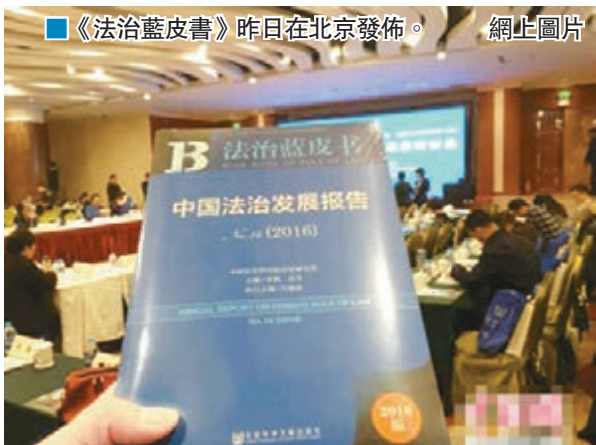
《法治藍皮書》昨日在北京發佈。

香港文匯報訊(記者 馬靜 北京報導)中國社會科學院法學研究所昨日在京發佈2016年《法治藍皮書》。藍皮書預測,2016年嚴重危及中國政權安全 and 人民群眾生命安全的暴力恐怖犯罪情勢依然非常嚴峻,同時,職務犯罪則會隨著反腐深入增量明顯下降、存量有所減少,大要案總量也會降低。