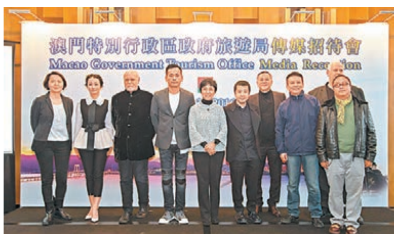
澳門旅遊局日前舉行記者會，一眾嘉賓合照。

近日正值香港國際影視展，澳門旅遊局聯同文化局首度參與，不單設立「澳門館」促進業內交流及尋找合作機會，更宣佈會在今年12月8日至13日舉行「澳門國際影展頒獎典禮」；發佈活動當日廣獲影視界名人支持。澳門旅遊局局長文綺華表示，已邀請著名意大利製片人、身為威尼斯影展總監十多年的馬可穆勒擔任活動總監，並由香港名導杜琪峯及許鞍華擔任活動推廣大使。