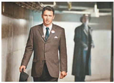
中無可避免成為孤獨者。

我沒有看過小說原著，劇中主角積克被設定為英文教師，不知是否書中設定。這個「教師」身份令人印象深刻的有兩處，一是積克在原本時空裡朗讀成年學生的創作，那是一個悲慘的童年，事件發生在1960年；第二處是他在1963年與學生討論《奧德賽》，還提及如回到過去的話，學生打算如何改變世界。這兩個細節，一個反映積克無法逆轉的宿命走向，另一個注定了他在過去的時空