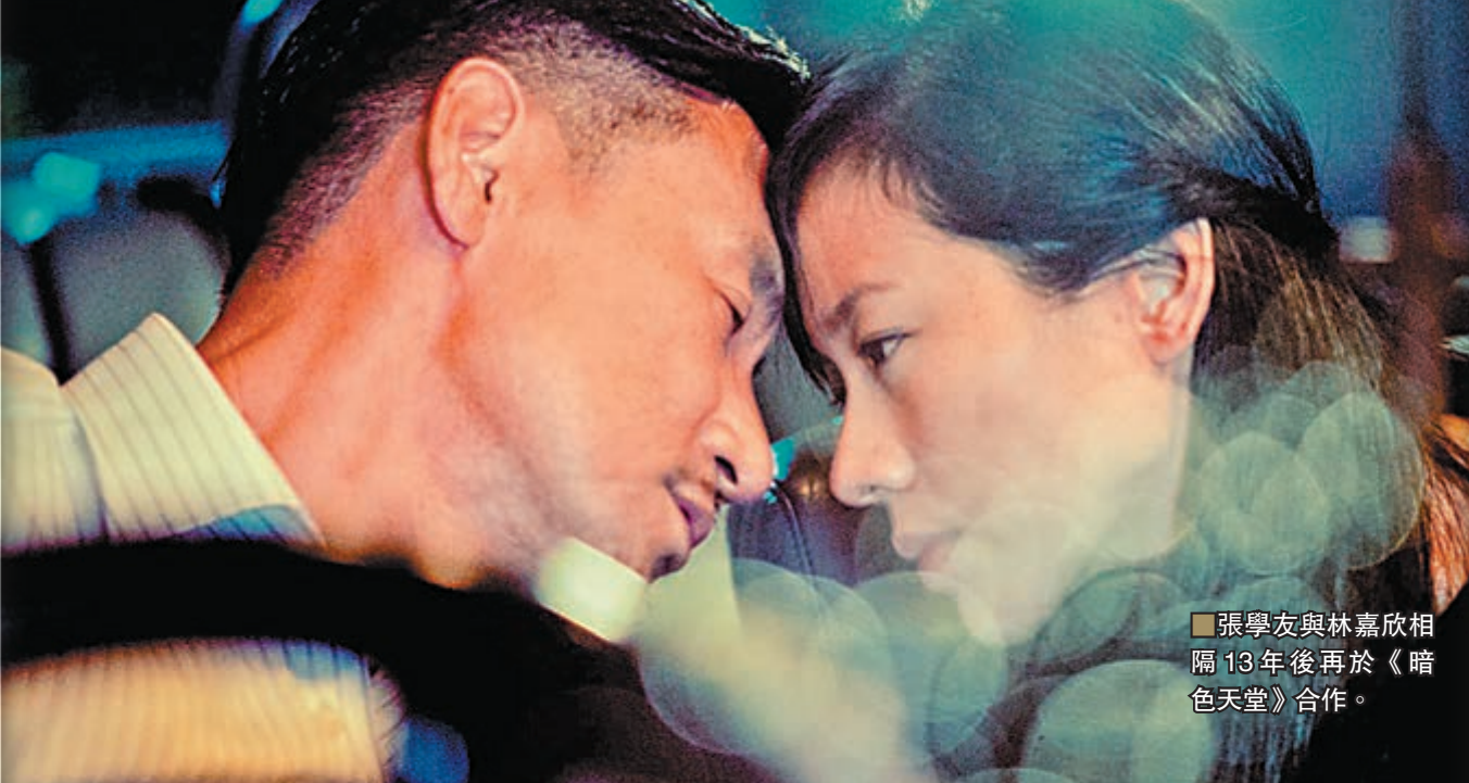
張學友與林嘉欣相隔13年後再於《暗色天堂》合作。

電影《暗色天堂》是袁劍偉首次執導的作品，雖要到下周四才上映，但已引來不少迴響，特別是張學友飾演慈善機構總幹事兼牧師，演技令人大讚。每個人心中的那把尺都不同，會因為身份、信仰而有不同解讀，這是《暗色天堂》最具爭議性的地方。誰對誰錯難分真偽，要靠觀眾自行判斷與思考。