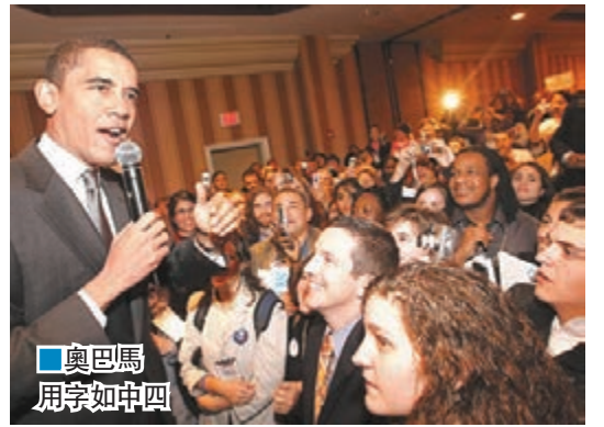
奧巴馬用字如中四