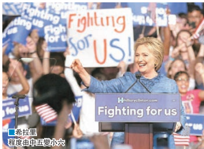
希拉里程度由中五變小六