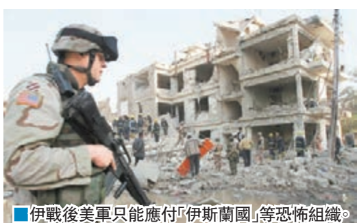
伊戰後美軍只能應付「伊斯蘭國」等恐怖組織。