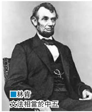
林肯文法相當於中五