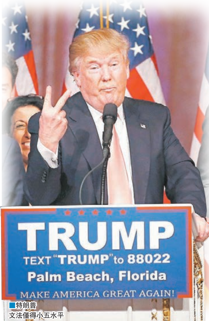
特朗普文法僅得小五水平