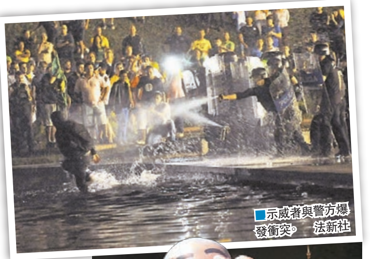
示威者與警方爆發衝突。