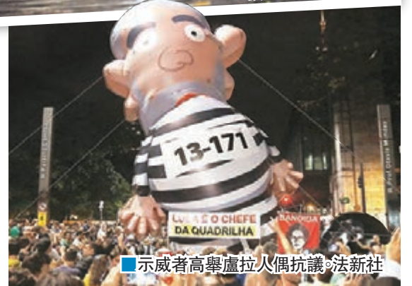
示威者高舉盧拉人偶抗議。