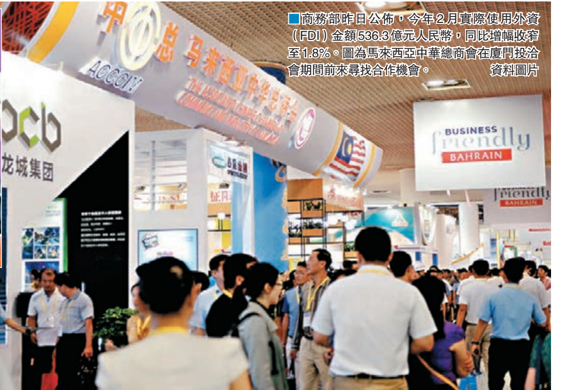
■商務部昨日公佈，今年 2 月實際使用外資（FDI）金額 536.3 億元人民幣，同比增幅收窄至 1.8%。圖為馬來西亞中華總商會在廈門投洽會期間前來尋找合作機會。 資料圖片