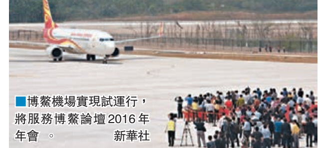
■博鰲機場實現試運行，將服務博鰲論壇 2016 年年會。

十多年來，博鰲亞洲論壇配套設施逐步完善。今年，不僅博鰲機場建成通航，作為論壇年年會重要活動基地之一的博鰲國賓館擴建項目也已全面竣工。