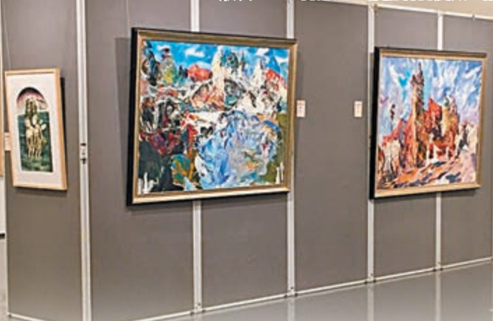
■今屆「愛和平」書畫展加入了油畫版塊。

雲間，千里山河幾日還，兩岸交流停不住，和平已過萬重山。」數言之間道出對於海峽兩岸和平發展的美好期望。他解釋道中國的哲學思想講究萬物和平共存、相互尊重和諧的關係才能促成發展，是故只有在和平交流的環境下，兩岸社會才能共享發展的「紅利」，書法本身蘊含「和諧」的老莊思想，正是承載和平祝願的最佳媒介。