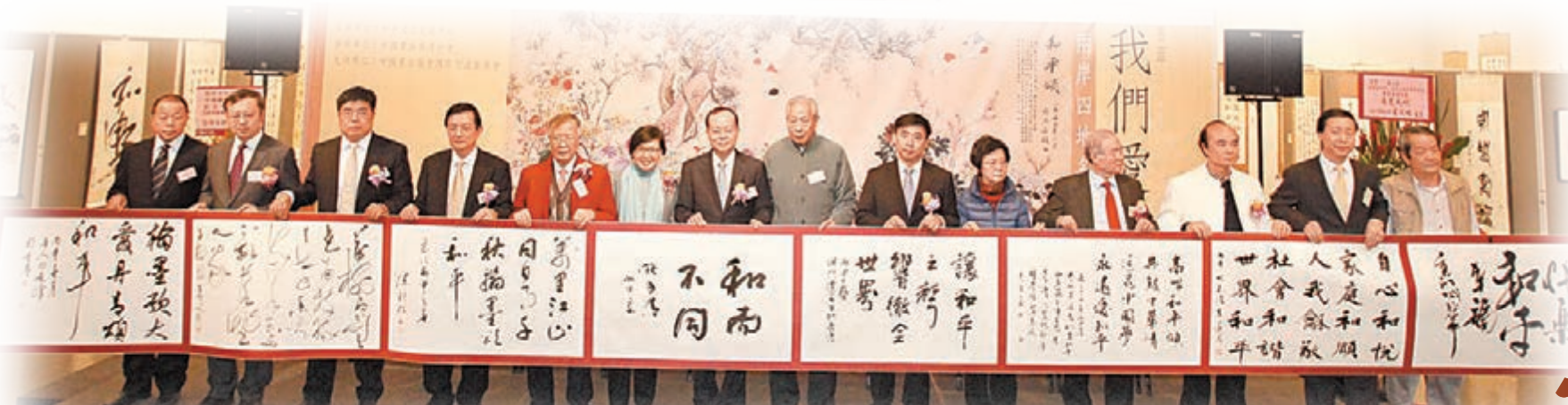
■來自兩岸四地的10位藝術家即場揮毫書寫「我們愛和平」10米書法長卷。

中央政府駐香港聯絡辦公室副主任楊健、中聯辦宣傳文體部部長朱文及特區政府民政事務局副局長許曉暉等出席了當日的開幕禮。中國書法家協會香港分會主席施子清等來自兩岸四地的10位書法名家，選於現場創作了以「我們愛和平」為主題的10米書法長卷。