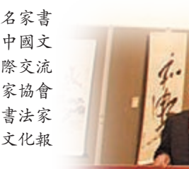
■來自兩岸四地的10位藝術家即場揮毫書寫「我們愛和平」10米書法長卷。