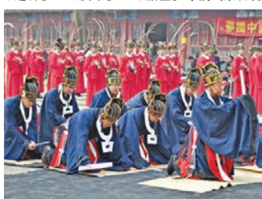
河北最大規模的春季「祭孔」活動在正定文廟舉行。

丙申年春祭釋奠禮昨日在河北省正定文廟舉行，來自海內外各界人士共300餘人參加釋奠禮。文廟內鐘鼓齊鳴，百餘名師生遵循古禮，通過「迎神」、「奠帛」、「獻禮」等儀式祭祀孔子。