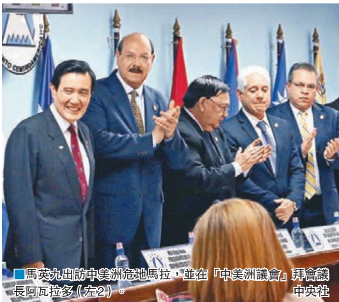
馬英九出訪中美洲危地馬拉，並在「中美洲議會」拜會議長阿瓦拉多(左二)。