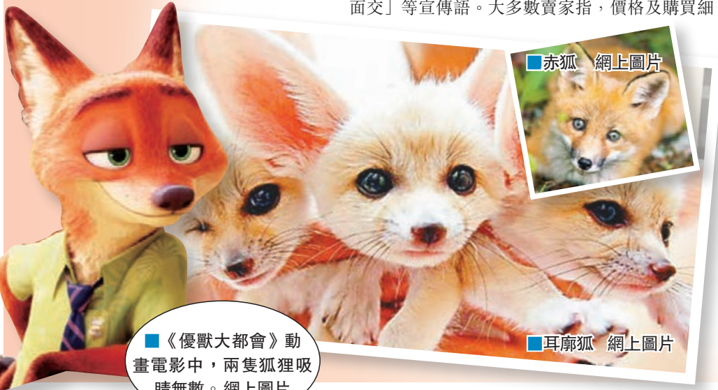
《優獸大都會》動畫電影中，兩隻狐狸吸晴無數。網上圖片

四川省林業廳野生動物保護處相關人士表示，耳廓狐除了享受國家二級保護動物的級別保護之外，亦已於2008年列入《世界自然保護聯盟》名錄。若要市場交易，必須通過一系列手續獲得資質方可合法進行。而個人買家很可能因沒有資格購買而違法。赤狐則是中國物種，屬於重點保護動物，有業內人士通俗地解釋道，赤狐可以售賣，但個人購買後不能讓其逃到野外。