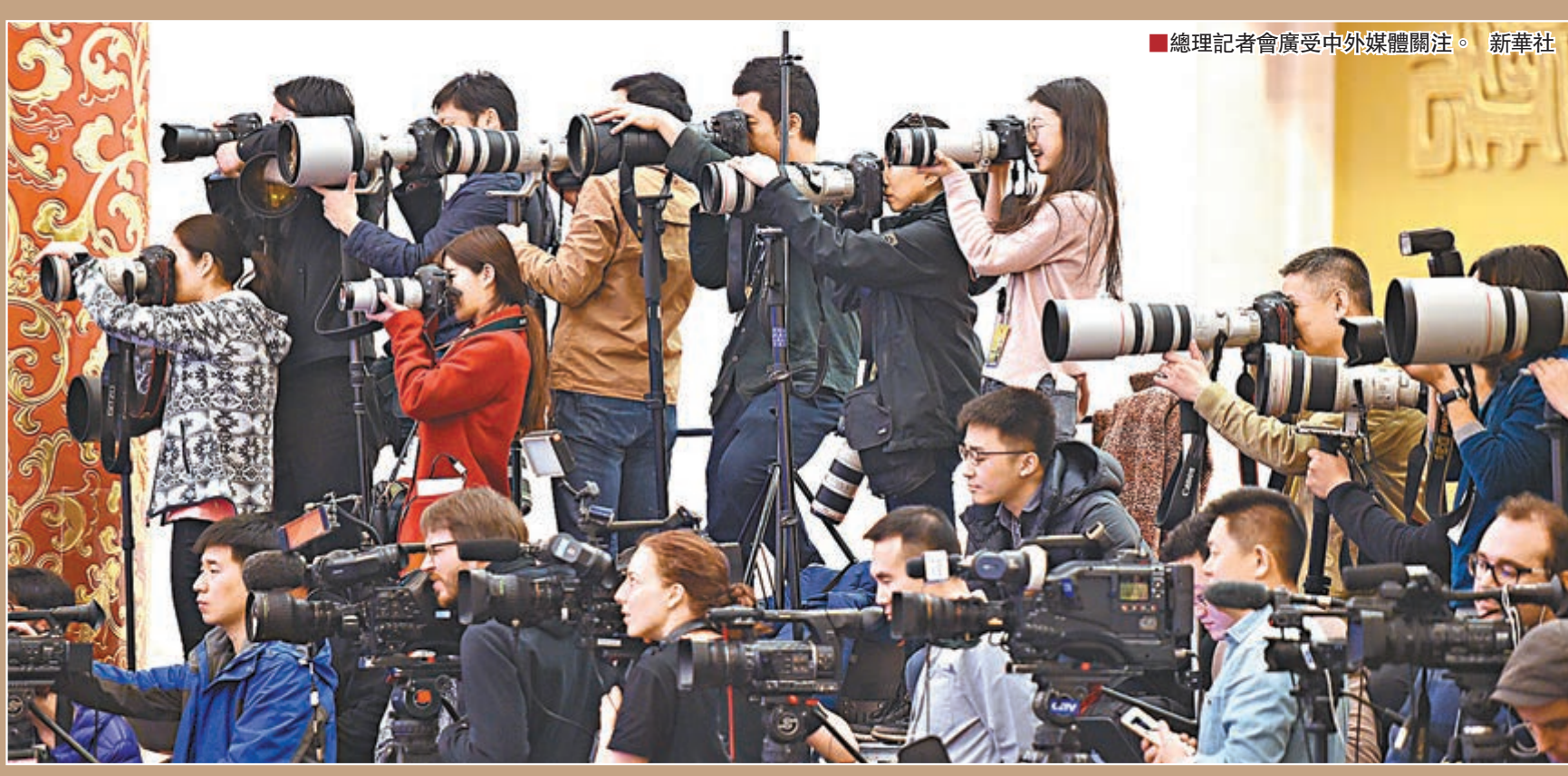
總理記者會廣受中外媒體關注。

李克強重申，中國正在推進現代化建設，發展是第一要務。「我們需要一個穩定的周邊環境和平和的國際環境，中國發展強大起來，是維護世界和平的有力力量，也有利於周邊。中國將堅定不移地走和平發展道路，維護國家主權和領土完整也毫不含糊，這兩者之間並不矛盾。我們希望，不論是域內國家還是域外國家，都能多做有利於地區穩定的事情，而不是相反，否則對誰都不利。」