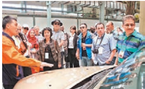
■絲綢之路經濟帶沿線國家客商考察蘭州新區，參觀吉利汽車工業園。

統計數據顯示，2015年，蘭州市環境空氣質量達標天數252天，同比增長5天，比2013年增加59天，2013年到2014年的冬天，蘭州市呼吸道疾病的病人就診率下降了27.3%，醫藥費用下降47.4%。