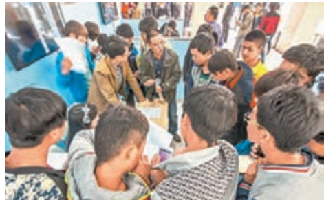
■蘭州新區成為大學生爭相就業、創業的熱土。