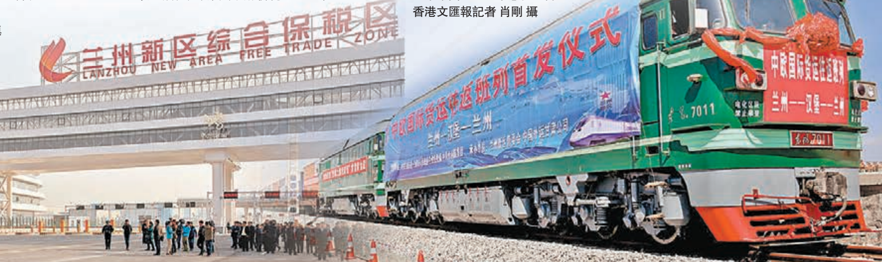
■中歐貨運班列常態化運營。