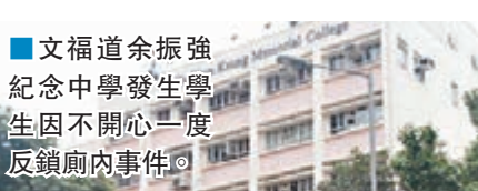
文福道余振強紀念中學發生學生因不開心一度反鎖廁所事件。

香港文匯報訊（記者杜法祖）何文田文福道一間中學一名17歲男生，昨晨8時許將自己反鎖廁所內，校方恐其會傷害自己，大驚報警。警員及消防員到場立即好言相勸，未幾將男生勸服開門，證實其並無受傷，但仍將他送院檢查。警方調查後相信有人只是一時不開心，事主亦否認企圖自殺，遂將案列作雜項事件處理。