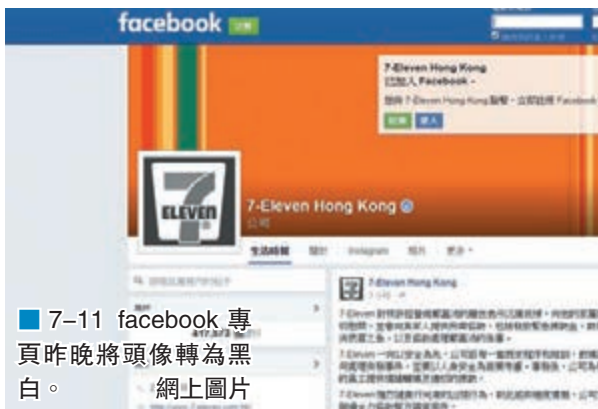
7-11 facebook專頁昨晚將頭像轉為黑白。

香港文匯報訊（記者杜法祖）油麻地碧街便利店東主本月8日疑遭竊賊尋仇插胸命案，警方事後拘控一名越南籍男子企圖謀殺及店舖盜竊罪。重傷店東經7天留醫搶救，延至昨日下午4時許終告不治。警方稍後將安排驗屍以確定其死因，並將案件改列作「謀殺」及「店舖盜竊」案處理。