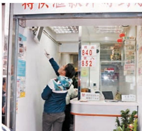
探員翻看店內閉路電視緝兇。