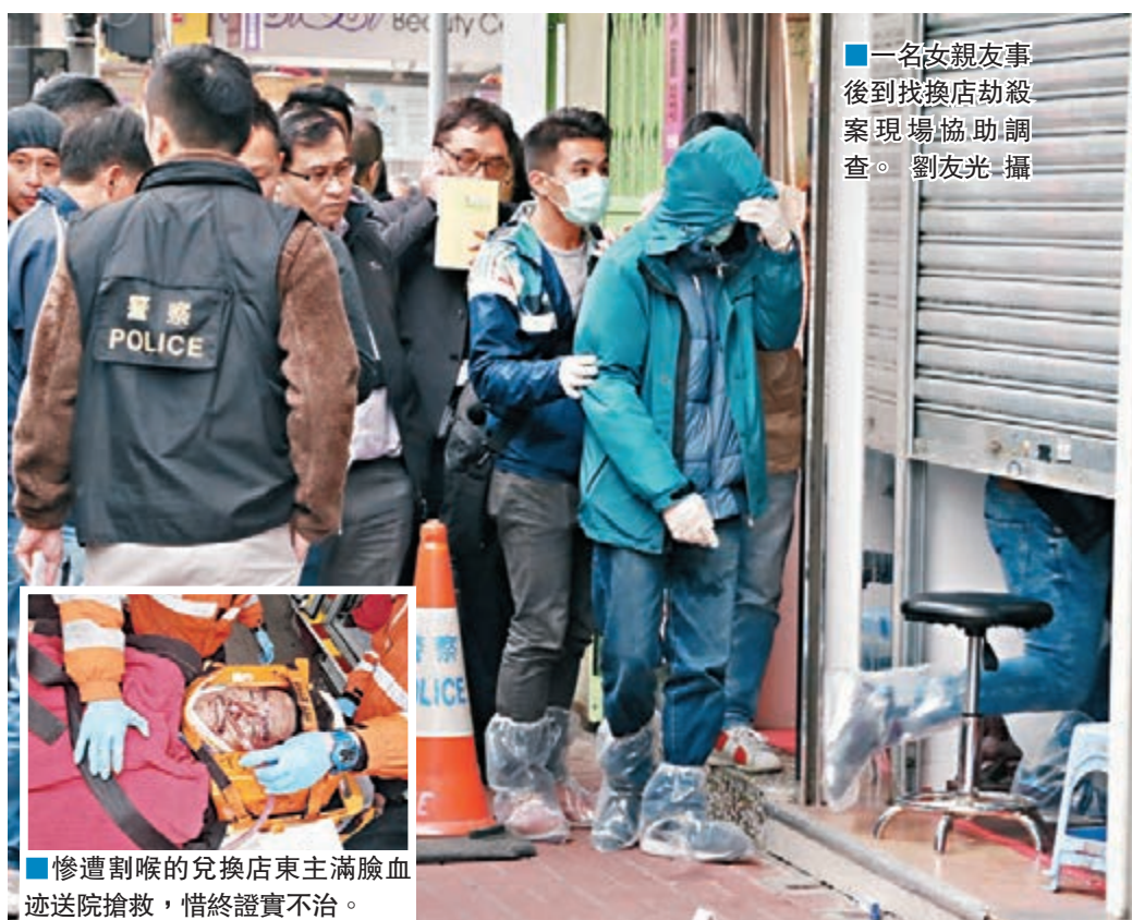
一名女親友事後到找換店劫殺案現場協助調查。

香港文匯報訊（記者劉友光、杜法祖）大埔發生極度兇殘劫殺案。一名涉曾捲入500億港元跨境洗黑錢案的七旬兌換店東，昨晨身懷鉅款返回運頭街店舖開門營業時，遭獨行劫匪尾隨入店打劫。他奮力反抗時慘遭歹徒以利器刺破喉嚨，當場血如泉湧倒地昏迷，悍匪搜掠15分鐘後始施施然離去。店東臥倒店內逾個半小時始被顧客發現，報警送院證實不治。警方正點算兌換店損失數字，新界北總區重案組已接手緝捕兇徒歸案。