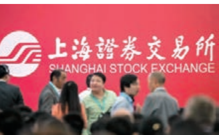
上交所昨公佈，與倫交所合作初步達成共識。

香港文匯報訊 上海證券交易所昨於官方微博公佈，近幾個月來，上交所和倫敦證券交易所雙方高層和工作團隊開展互訪、積極交流。