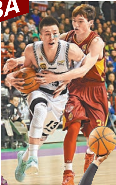
遼寧球員郭艾伦(左)在比賽中帶球突破。