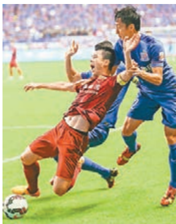
上海打吡備受關注。