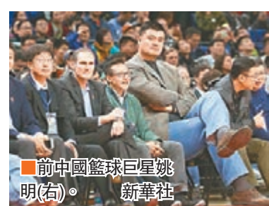
前中國籃球巨星姚明(右)。