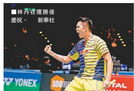
林丹在獲勝後慶祝。