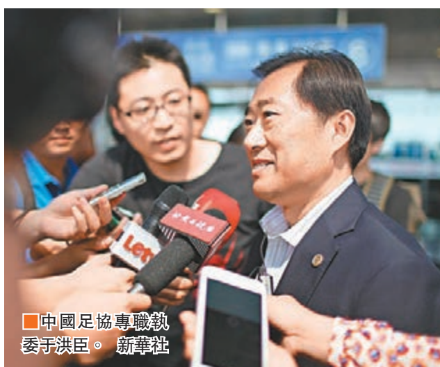
中國足球專職執委于洪臣。