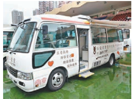
仁愛堂流動牙醫醫療車,預計每年可以服務3,000人次。