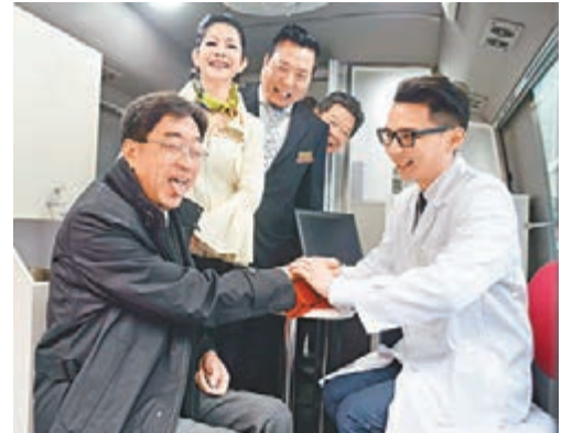
高永文參觀流動牙醫醫療車。