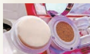
瞬白無瑕氣墊粉底

其中的全新瞬白無瑕氣墊粉底 SPF50+/PA+++ 採用獨特網狀氣墊設計，塑造高效遮瑕的絲滑妝感。而經典瞬白亮肌氣墊粉底則採用海綿氣墊設計，輕易打造清新水盈的自然妝感。同時，全方位防禦抗曬清爽乳霜 SPF 50/PA++++ 採用雙重防護效能，12 小時長效抵禦 UVB，同時抵抗城市污染侵害，全天候周全防護。