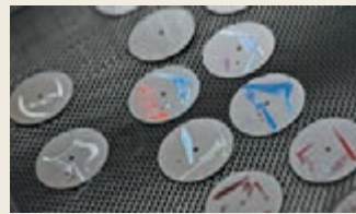
各款錶面設計成品