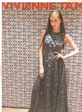
以「麻將」為設計靈感，穿上上來分外親切。