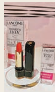
瑰麗豐盈唇膏 368Rose 色