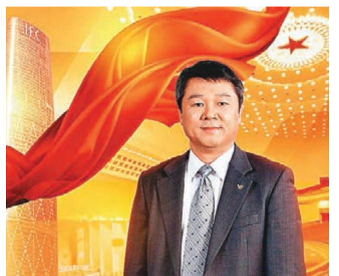
張招興建議加快推進房貸利息抵扣個稅。

香港文匯報訊(記者 胡若璋 兩會報道)近期,關於「房貸利息抵扣個稅」的傳聞不斷。市場普遍認為,房貸利息抵扣個稅一舉多得。不僅可加速消化房地產庫存,有利解決目前商品房庫存高企和結構過剩的突出問題,降低經濟金融風險,還能切實增加城鎮居民可支配收入,提升消費能力。全國人大代表、越秀集團(0123)董事長張招興出席兩會期間建議,當前應加快研究推出房貸利息抵扣個稅政策,有限額減免個人所得稅。