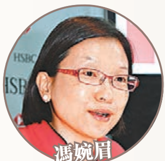
馮婉眉 恒隆(0101) 港交所(0388)