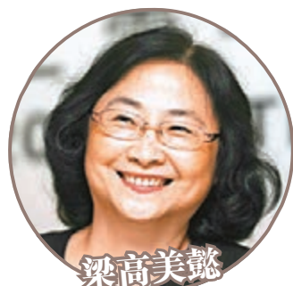
梁高美懿 建行(0939)、港交所(0388) 利豐(0494)、新地(0016)