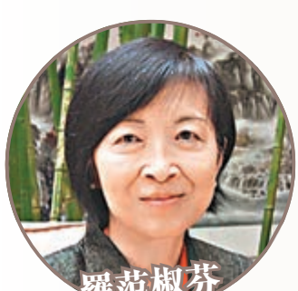
羅范椒芬 中聯通(0762) 中電(0002)