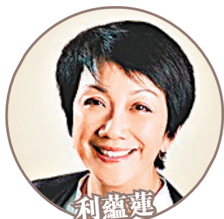
利蘊蓮 國泰(0293)、中電(0002) 恒生(0011)、匯控(0005)