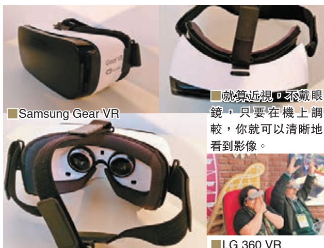
Samsung Gear VR

去年, 在 MWC 中, 已有 VR 虛擬實境的产品出現, 不過就以遊戲為主, 今年連手機品牌都加入其中, 如 Samsung Gear VR、HTC Vive 及 LG 360 VR 便在 MWC 中亮相。例如, 這部 Vive 是與遊戲開發公司 Valve 合作, 搭配三款完整內容, 內含 Google 的 Tilt Brush, 令大家在虛擬實境空間中作畫, 享受筆刷、星芒、閃電與火焰在立體空間中的創意交織。Vive 更提供創新功能——Vive Phone Services, 讓用戶沉浸於虛擬世界時, 也能同時與現實生活溝通聯繫, 可透過頭戴式顯示器接聽電話、回覆未接來電、接收並快速回覆簡訊並查看行事曆日程規劃。