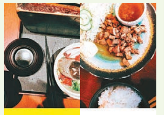
Foodie 會提示你手機擺位正確。

此外, Foodie 極強調「最佳角度」, 當把手機以水平方式放到食物上方, 擺得夠水平即會出現「Best Angle」字樣, 叫你可放心按快門。望真點, 那豈非飲食雜誌常見的拍攝角度? 當然本 App 不少得一按鍵便把靚相上載到社交網站的功能啦。