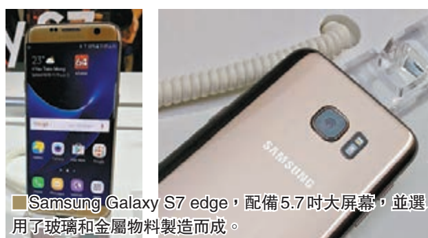
Samsung Galaxy S7 edge, 配備 5.7 吋大螢幕, 並選用了玻璃和金屬物料製造而成。