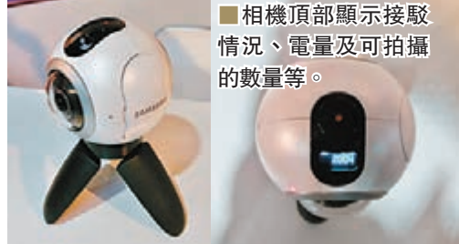
相機頂部顯示接駁情況、電量及可拍攝的數量等。