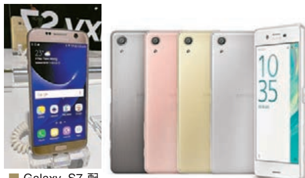
Galaxy S7 配備 5.1 吋大螢幕, Sony Xperia X Performance 系列符合人體工學的雙邊曲面側屏幕設計。

一向以拍攝功能著稱的 Sony Xperia 系列, 今年在 MWC 2016 中, 發表全新一代 Xperia X 系列, 系列中的相機提升更高層次, 將隨心即拍的照片都精準拍下, 銳利細緻, 由品牌 α 影像工程師研發的全新可預測混合式對焦配置在 Xperia X 及 Xperia X Performance 智能手機, 可以精準地預測主體的移動路徑, 輕易地即時捕捉完美一刻而不會失準模糊。