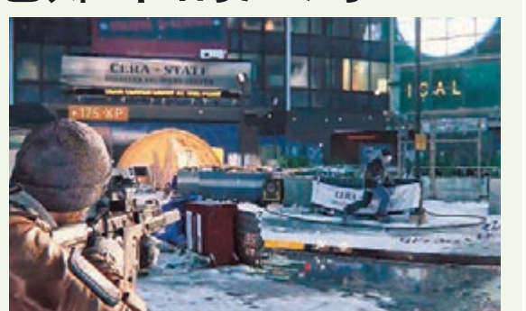
在《全境封鎖》中, 玩家須應付疫區紐約的不同勢力。

採用第三人視點射擊玩法的《全境封鎖》, 是一隻開放式 RPG 而非典型主觀射擊類型, 講述紐約受疫症影響導致政府運作癱瘓, 頓令這地方變成「無王管」, 四個取態與目標不同的勢力隨即四出霸地盤, 市民安危不再受保障。玩家隸屬曾接受特殊訓練、毋須指揮都能獨立行動的「國土戰略局」, 可選擇單獨或組隊出動, 並藉戰鬥後搶奪敵人的裝備來強化自己, 還可不斷取得新的能力, 以應付及後更艱難的任務。而天氣變化是本作一大特色, 對行動策略上構成重要影響。當然, 廠方在本作亦設有供玩家對戰的「暗區」模式, 獨自享受劇情發展之餘也可與眾同樂。至於《全》的遊戲季票內容, 已知最少有兩個新模式與三個擴張劇情, 可讓機迷在今年稍後慢慢享用。