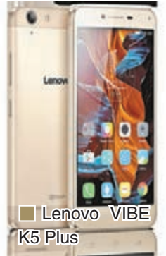
Lenovo VIBE K5 Plus