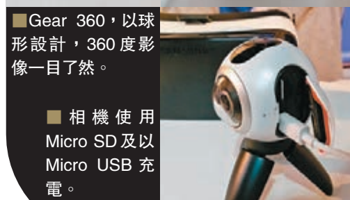
Gear 360, 以球形設計, 360 度影像一目了然。