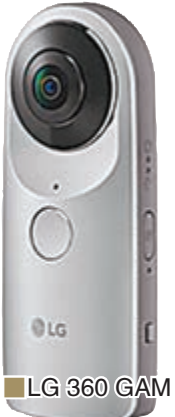
LG 360 GAM

今次, 筆者在現場發現不少品牌展示了虛擬現實 (VR) 全景攝像設備, 如 Samsung 的「Gear 360」及 LG 的「360 GAM」, 就以這部 360 度攝影相機 Gear 360 為例, 它即將登陸香港, 其獨設兩個 1,500 萬像素影像感應器的魚眼鏡頭, 可拍攝超高清像素 (3,840 x 1,920) 360 度影片及 3,000 萬像素球形影像。其球形設計精巧, 方便用戶隨身攜帶, 從此可輕鬆製造、觀賞及分享影片及影像, 捕捉精彩瞬間。