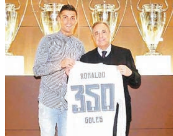
皇馬主席佩雷斯(右)贈C朗紀念球衣。

在昨凌晨戰罷皇家馬德里主場怒切爾達7：1的西甲第28輪賽事，C朗拿下下半場連入4球，為自己職業生涯增添一項紀錄。 C朗各項賽事為皇馬上陣335場入了352球，葡萄牙球王成為西甲、英超、德甲和意甲四大聯賽中，最快為一支球隊入滿350球的球員。單計聯賽C朗的252球亦超越了名宿沙拉，登上西甲歷史入球榜第2位。至於單場入3球則是C朗在西甲的第30次，比美斯的西甲「帽子戲法」多4次。 巴利復出兼埋窩 皇馬已難望贏得今季聯賽冠軍，不過主帥施丹認為C朗將可助他們在歐聯有作為：「C朗是獨一無二的……在這樣的比賽中入4球，我就做不到了，踢歐聯前C朗有這狀態很重要。」C朗此戰一記三十碼外的曲毆「世界波」直接回擊了球迷的