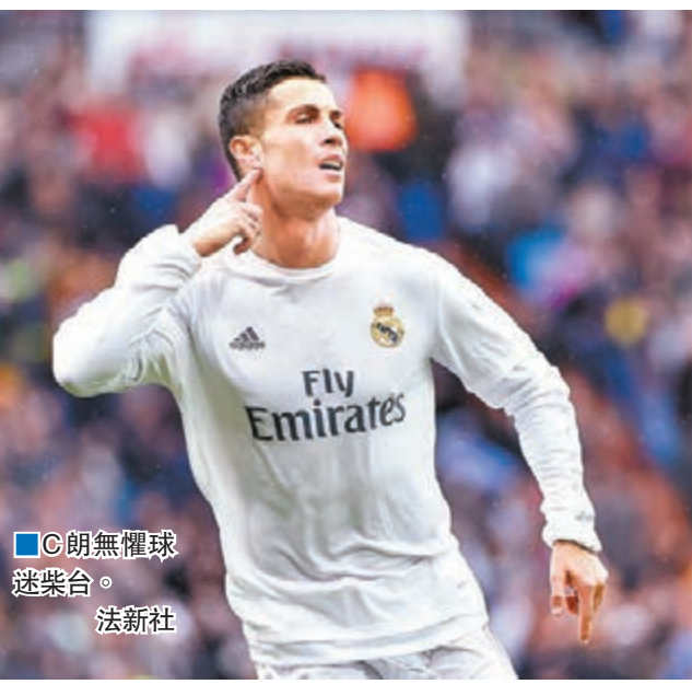
C朗無懼球迷聲浪。 法新社

曼城積50分排第4，仍少踢一場，將於今夏離職的領隊柏歷堅尼說：「我們還少踢1場，冠軍仍掌握在自己手中。」不過，事實上「藍月」餘 曼城翼鋒史達寧(右)突破維拉防線。 法新社