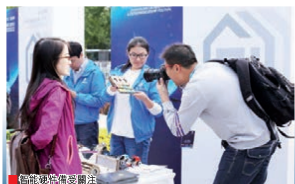
智能硬件備受關注