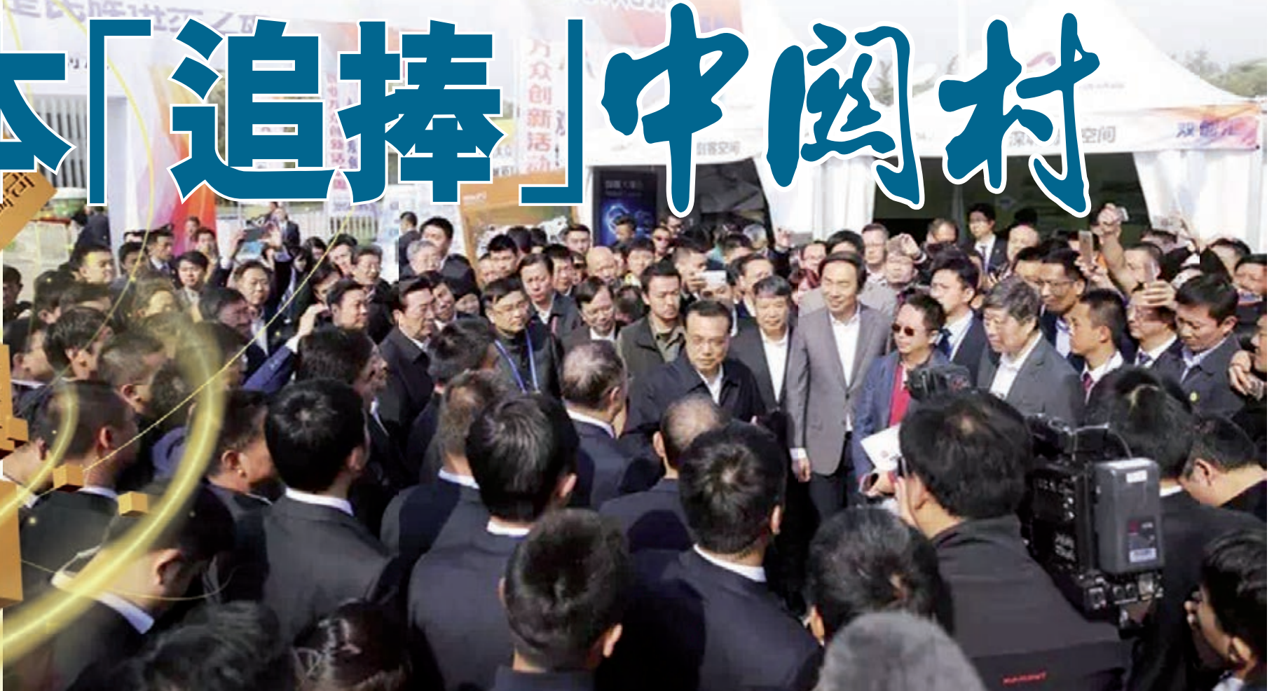
李克強總理在雙創周主會場

在資本市場上，提起中關村，人們總會自然地聯想起創業板、新三板，從某種意義上說，中關村已經成為創業板、新三板的代名詞。作為中國首個國家級高新技術產業園區和國家戰略性新興產業的策源地，中關村成為嗅覺靈敏的風險投資者們爭相湧入的地方，IDG、聯想投資、今日資本、北極光創投等一批境內外知名機構常年紮根中關村。而資本緣何「追捧」中關村？風投家指出，市場、技術和人才缺一不可，而中關村是難得能將三者集於一身的地方。有了資本的助力，在帶動更多的創業者投身創新大潮推動科技進步這條道路上，中關村正在書寫劃時代的意義。