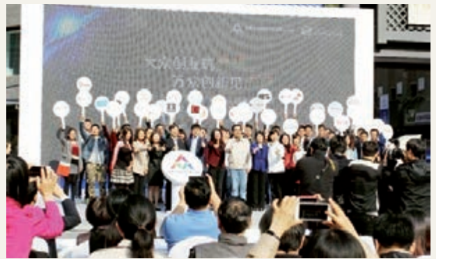
大眾創業 萬眾創新

截至2015年12月末，以北京中關村信用促進會為平台進行征信的企業會員累計達到5,961家，全年新增會員623家。信用星級企業累計達到1,211家，一星級企業545家，二星級企業239家，三星級企業153家，四星級企業108家，五星級企業166家。累計有近1萬家中關村示範區企業使用各類信用產品2萬餘份。