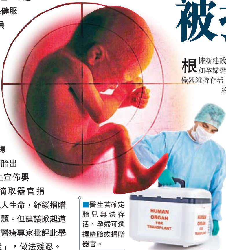
■醫生若確定胎兒無法存活，孕婦可選擇墮胎或捐贈器官。

孕婦在懷孕初期接受檢查時，若發現胎兒有嚴重畸形，如患無腦症、遺傳性心臟病或腦部出現不可逆轉損害，通常選擇人工流產。不過，英國國民保健服務(NHS)負責移植手術的醫生，在英國器官移植協會年會上提出新建議，指孕婦可考慮讓畸胎出生，到醫生宣佈嬰兒死亡後摘取器官捐出，拯救他人生命，紓緩捐贈器官短缺問題。但建議掀起道德爭議，有醫療專家批評此舉「等同盜屍」，做法殘忍。