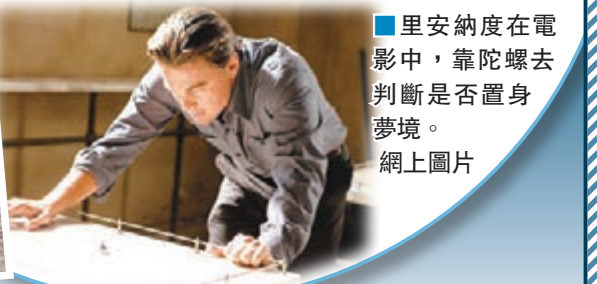
■里安納度在電影中，靠陀螺去判斷是否置身夢境。網上圖片