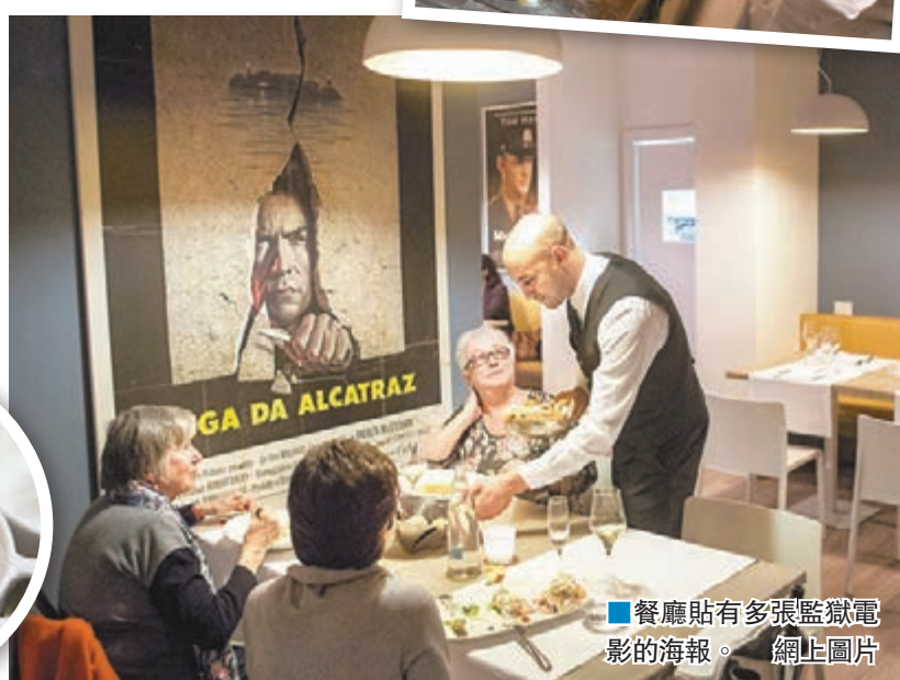
■餐廳貼有多張監獄電影的海報。

意大利前年透過降低刑罰及釋放輕微罪犯人，雖然紓緩了監獄擠迫情況，但未能解決重犯率高企問題。有見及此，當局開始在中度設防監獄，容許囚犯在日間自由走動，而為了讓他們生活更充實及學會一技傍身，各地監獄遂招攬義工，為囚犯提供