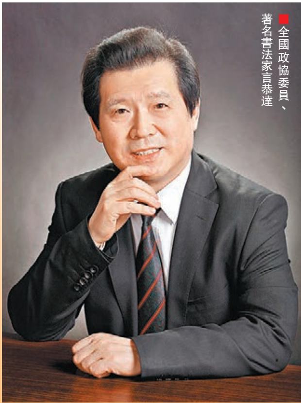
■全國政協委員、著名書法家言恭達

以書法藝術為代表的中華傳統文化，因其民族性和獨特性，享譽全球。而中華文化要真正走出國門、提升國際影響力，絕僅不是藝術家單一到國外舉辦一次展覽，或是交流參觀。全國政協委員、著名書法家言恭達連年上書「兩會」，為中華文化如何走出去建言獻策。他把博大精深的中華文化溶於筆下，頻頻走出國門，用書法獨有的藝術感召力，和一個東方書法家虛懷若谷的人格魅力，突破了世界不同文化之間的藩籬。