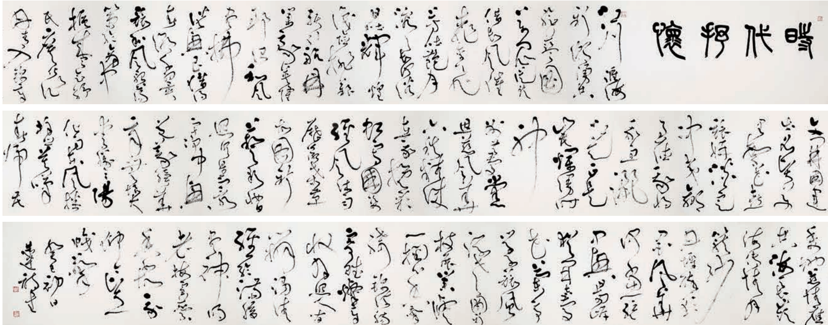
■言恭達「時代抒懷」書法長卷