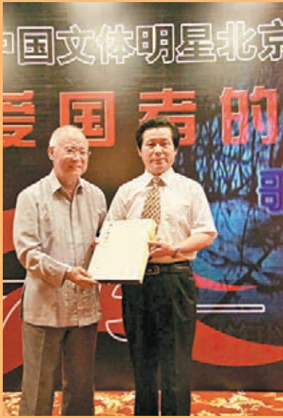
■2008年7月，《我的中國心一言恭達書何振梁在莫斯科申辦第二十九屆奧運會的陳述演講》大草書法長卷在北京首發，何振梁接受書法長卷。