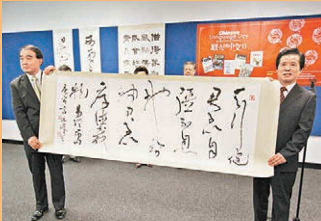
■2010年11月12日，聯合國首屆中文日舉辦言恭達書法特展。中國駐聯合國特命全權大使李寶東接受捐贈。

言恭達熱衷於社會公益與慈善事業，多年來個人為四川汶川、青海玉樹、四川雅安等地震災區、安徽貧困地區、江蘇紅十字孤兒學校、全國艾滋病防治、江蘇省體育發展基金等無償捐資一千多萬元，並捐資建立「南京言恭達慈善基金」、「東南大學言恭達教育基金」、「北京語言大學言恭達藝術文化教育基金」等。2008年被江蘇省人民政府授予「博愛勳章」，2010年被國務院防治艾滋病工作機構授予「愛心形象大使」稱號、全國政協「善行天下政協委員慈善公益代表人物」，2011年榮獲國家「第六屆中華慈善獎、最具愛心行為楷模」稱號等，2012年建立「言恭達文化基金會」，2013年榮獲江蘇省人民政府頒發的「紫金文化榮譽獎章」。