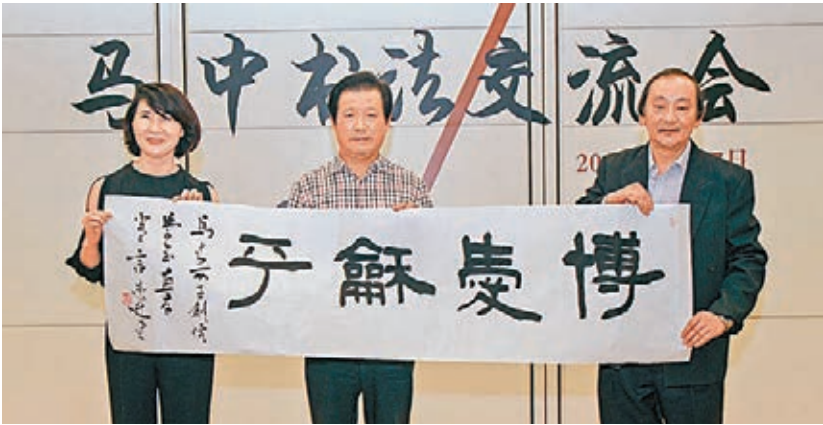
■言恭達2013年率中國文聯代表團訪問馬來西亞並進行交流。

2013年底，言恭達向北京語言大學捐贈人民幣一百萬元，專門用於獎勵和資助北京語言大學留學生及中國書法篆刻研究所海內外書畫藝術活動、出版等多種項目。言恭達說，北京語言大學被稱為「小聯合國」，有來自世界180多個國家一萬多名學生在這裡學習。「以我名字設立這個藝術文化基金，是希望能為培養各國留學生學習中國書法藝術盡一己之力。我們現在在做中國文化由『送出去』到『請出去』，而培養留學生將使他們學成後將中國文化『帶出去』。每個來中國學習的留學生，回到自己的祖國，都會成為文化交流最具說服力的使者，他們培養起來的書法興趣，也必然會讓這門古老的藝術在更多的土地上生根發芽。」