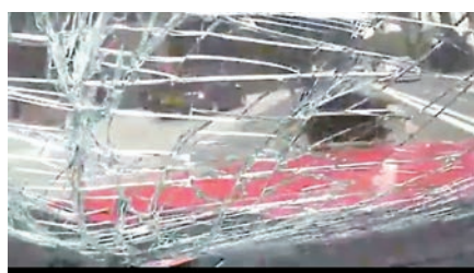
■該男子將的士擋風玻璃撞至碎裂。