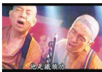
■有網友揶揄對方是懂「鐵頭功」的「大師兄」。