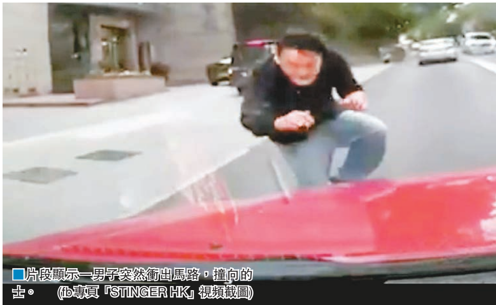
■片段顯示一男子突然衝出馬路，撞向的士。(fb專頁「STINGER HK」視頻截圖)