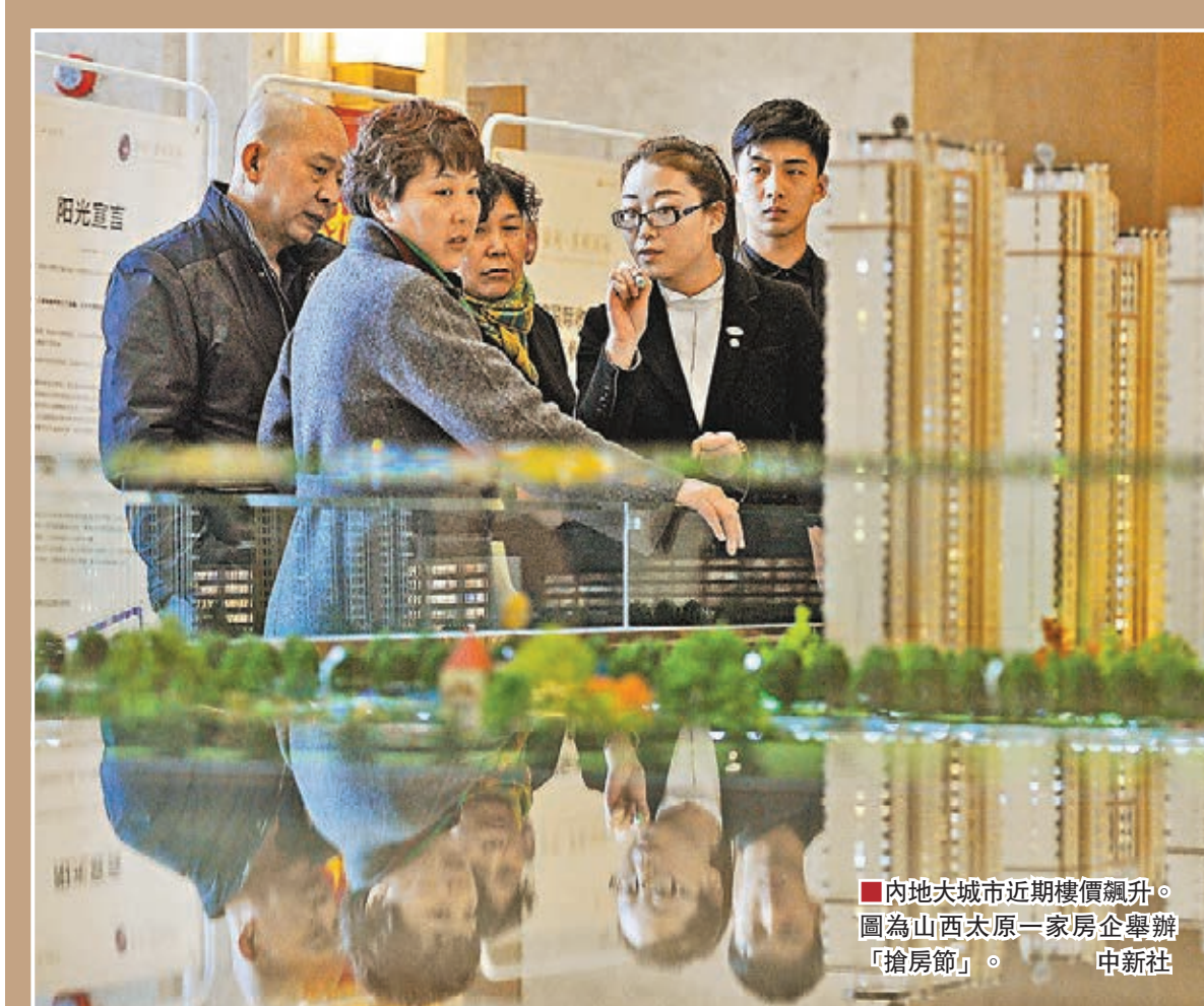
內地大城市近期樓價飆升。圖為山西太原一家房企舉辦「搶房節」。

此外,全國政協委員、住建部副部長易軍,就全國熱議的拆圍牆問題接受採訪時表示,這目前只是一個方向,還有很多細則、法律法規來配套。易軍說,這個政策並非突然提出,經歷了國內外的差異對比,上下認真徵求意見,這是一個方向,中國還需要一個長期的過程。對於民眾巨大的反應,他說之前想到民眾會在意,但國內媒體把這個事情炒得更厲害了。對於拆除圍牆涉及物權法可能帶來糾紛,他表示會尊重廣大民眾,依法辦事。他表示,會多注意疏導、注意宣傳,對未來的發展理念進行宣傳和溝通,來爭取民眾對這一政策的支持。