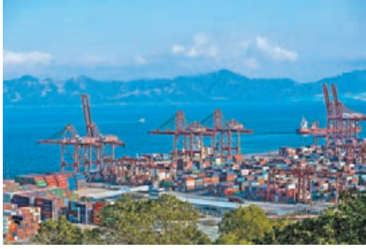
廣東外貿總值已連續兩年下降。圖為蛇口港。

一線穩定樓市措施 1.繼續實施嚴格限購; 2.增加土地供應面積; 3.增加中小套型供應,搞好保障性工程建設; 4.打擊違法違規交易。 資料來源:記者馬靜整理 陳政高透露,目前內地房地產市場庫存量達到7.18億平方米,「去庫存」仍是今年重點任務。