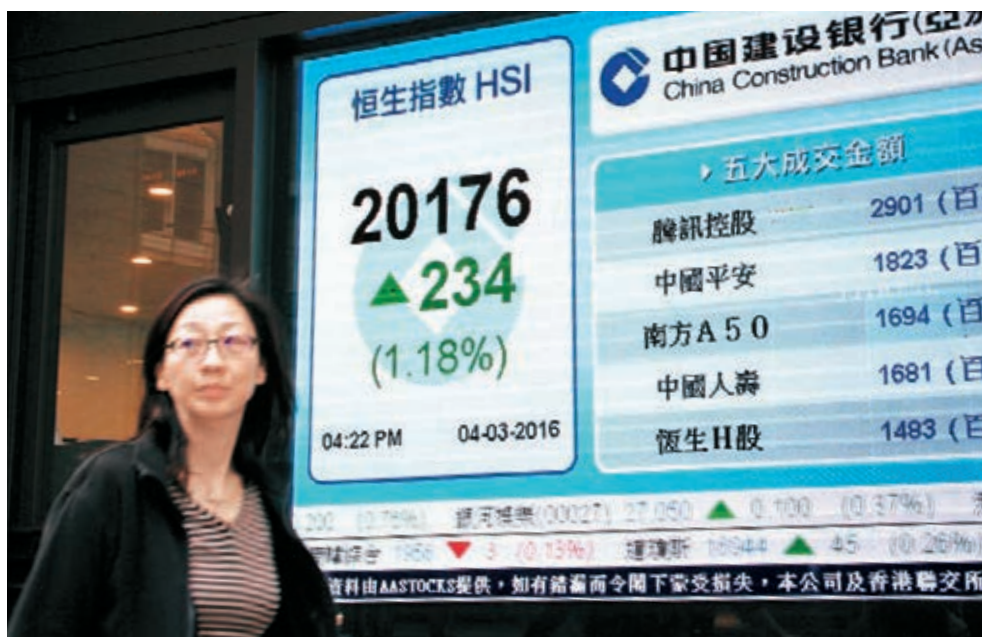
恒指昨升234.9點報20176.7點,重上2萬點大關。

香港文匯報訊(記者 周紹基) 避險情緒持續降溫,加上預期美國不加息,令地產股造好,地產指數全日升2.7%,跑贏大市,全周更有8%進賬,大幅跑贏同期4.2%升幅的恒指,長實(1113)更周升12.73%,表現搶眼。分析員指出,中原城市領先指數CCL按周回升,推動地產股有買盤吸納,相信地產股下周表現也不俗。