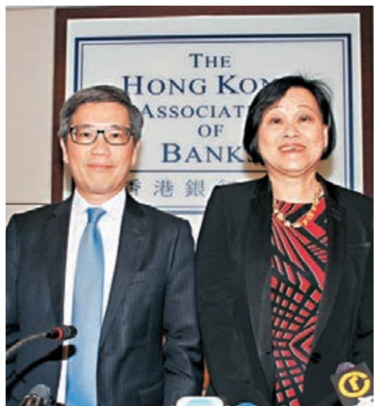
銀行公會主席陳秀梅(右)及金管局副總裁阮國恒。

香港文匯報訊(記者 黃萃華) 近半年樓價下跌,絕跡多時的負資產重現,市場有聲音建議金管局調整逆週期措施。金管局副總裁阮國恒昨認為,早前樓價出現下跌,但上月又見回穩,因此目前仍然未能判斷樓市周期情況,但當局會密切注意。