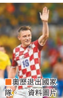
奧歷退出國家隊。資料圖片

在1994年至1997年出任葡超球隊賓菲加的前主席達馬斯奧，疑涉貪污、洗黑錢、以權謀私和逃稅，周四被葡萄牙警方拘捕。