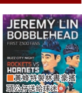
JEREMY LIN BOBBLEHEAD FIRST 7500 FANS 黃蜂特製林書豪搖頭公仔送給球迷。

勇士後衛史提芬居里(咖哩仔)因足踝傷避戰1仗後，周四復出即轟進全場最高的33分，帶領勇士在主場以121:106完成今季對雷霆的橫掃，並將主場連勝紀錄改寫至44場，追平1995/96年球季由公牛創下的紀錄。