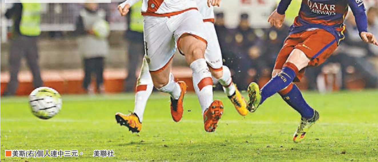
美斯(右)個人連中三元。