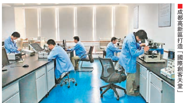
■成都高新區打造「國際创客天堂」

截至目前，成都高新區聚集各類股權投資機構近400家，管理資金規模超過750億元，助3,000餘家企業獲得擔保貸款數百億元。近期，美國