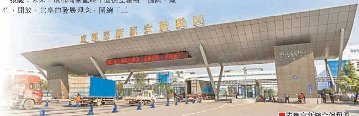
■成都高新綜合保稅區

區一極」發展方向，積極開展創新政策先行先試，激發各類創新主體活力，着力研發和轉化國際領先的科技成果，打造一批具有全球影響力的創新型企業，全面提高自主創新和輻射帶動能力，努力把成都高新區建設成為國際創新創業中心。力爭到2020年，實現全口徑產業總產值10,000億元人民幣，聚集科技企業10,000家，聚集高層次創新創業人才10,000人，發明專利授權累計超過11,000件，制定國際、國家和行業標準1,000項，建成具有全球影響力的創新創業中心。