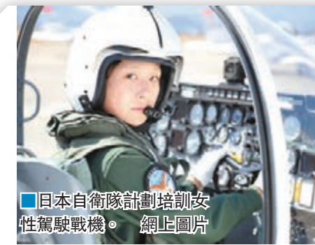
■日本自衛隊計劃培訓女性駕駛戰機。