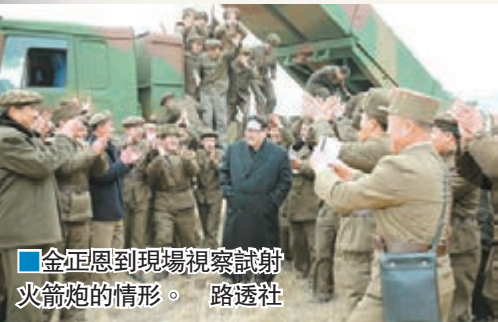
■金正恩到現場視察試射火箭炮的情形。