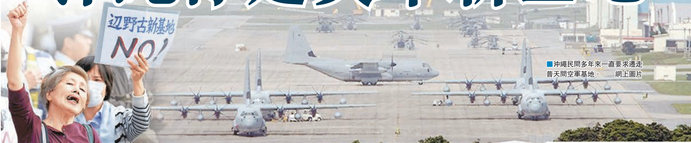
■沖繩民間多年來一直要求遷走普天間空軍基地。 網上圖片