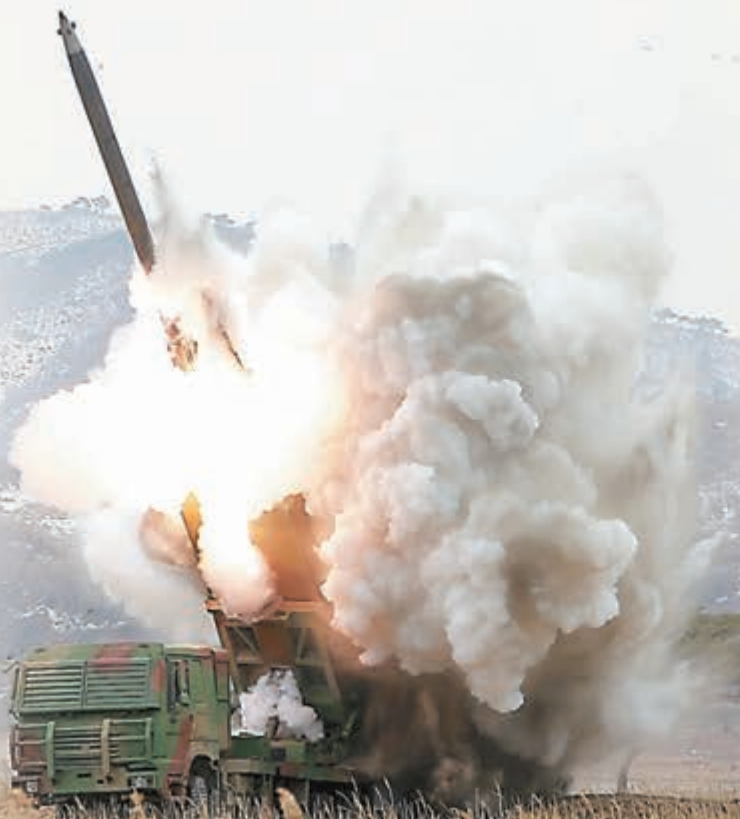
■朝鮮昨日發放試射新型大口徑火箭炮的照片。