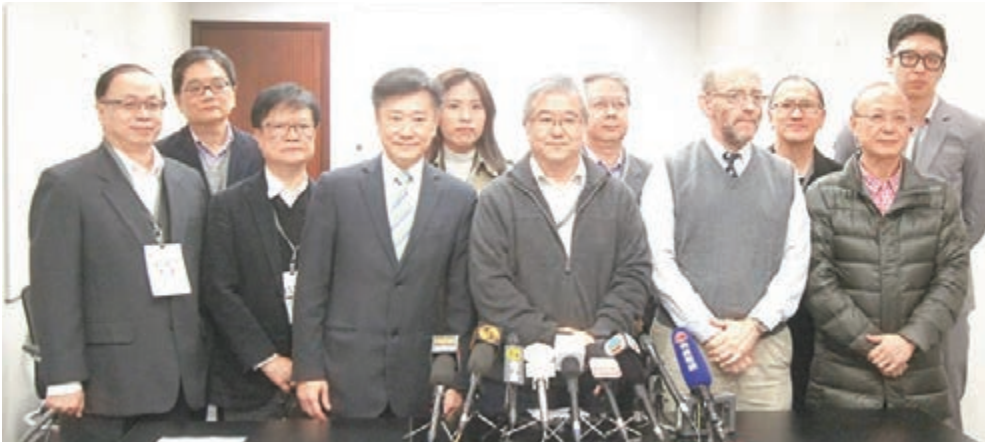
■香港版權大聯盟形容昨日是「議會政治最黑暗的一天」。