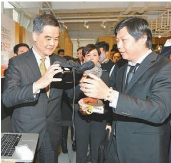
■行政長官梁振英昨主持香港專業人士（北京）協會創新工商委員會成立典禮，並在典禮後參觀WE+眾創空間，與在北京創業的年輕人交談。

他說，「大家可以想像得到如果創新及科技局不是在3年半後的3個月前成立，而是可以在3年半前成立，不失時機地成立，今日我們的創新和科技事業可能已經有了顯著的成績。這是誰的損失呢？是社會的損失，是業界的損失，尤其是我們在創新及科技方面有志發展的青年人損失。」