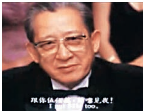
■電影《賭神》片段。「賭魔」陳金成：「跟你五百萬，開嚟見我！」 網上截圖 ■網民質疑「現金」的真確性。 網上截圖