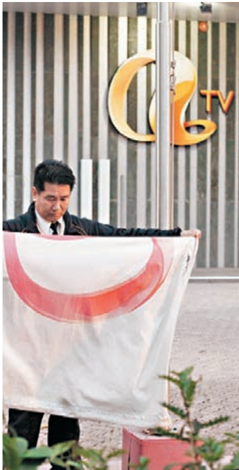
■亞洲電視每日會升降旗。圖為昨日降旗，今日仍會升起。