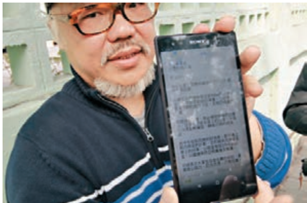
■吳先生展示《告亞視同人書》。