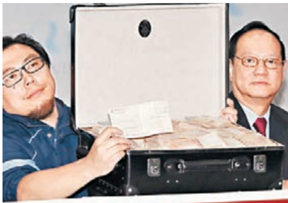
■亞視股東代表召開記者會，展示「500萬元現金」及500萬元支票顯示財力。

勞工處表示，自上周五至今，已收到約230個破產欠薪保障基金申請，該處將陸續為其他同樣已離職的員工提供協助。