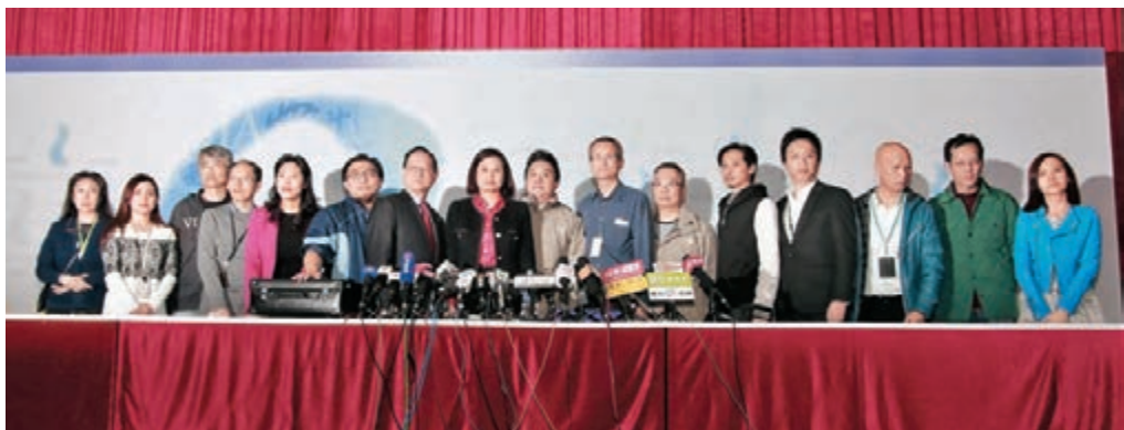
■何子慧稱，中國文化傳媒集團去年4月開始透過不同途徑支付員工薪金。