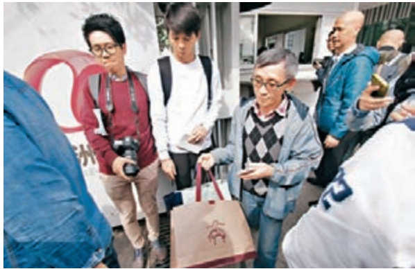
■亞視員工收拾物資離開公司。