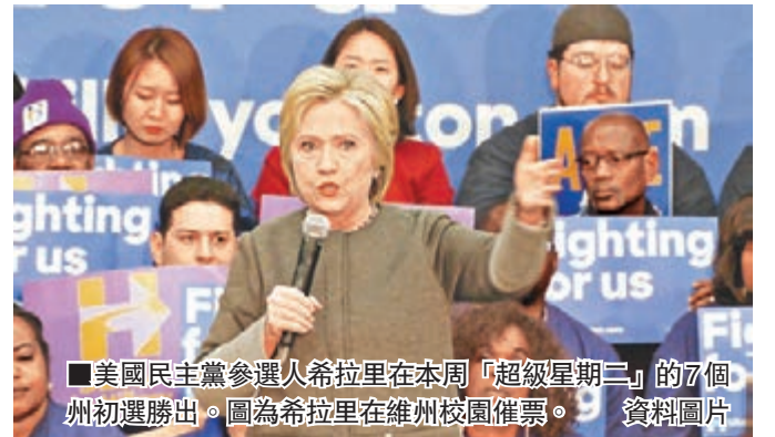
美國民主黨參選人希拉里在本周「超級星期二」的7個州初選勝出。圖為希拉里在維州校園集會。資料圖片

值得一提的是，回顧2000年開始的四次美國總統大選，標普500醫療產業指數表現強勁，打敗整體標普500指數的幾率高達75%，從目前的政策傾向來看，江宜度指出，共和黨若勝選，製藥廠及生物科技公司將受惠；民主黨若勝選，醫療服務類股可望迎來紅光。