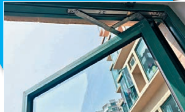
■住戶可留意窗邊牆身有沒有裂痕，防水膠邊是否變色或變得脆身。

遇上打風落雨大家都會緊張地立即把門窗關上，但如果關上了還有雨水滲入，實在是惡夢。王光宏指，未雨綢繆，住戶可檢查窗邊牆身有沒有裂痕，防水膠邊是否變色或變得脆身，這些都是窗邊出現滲水前的徵兆。要更換內外膠邊的話，約需170元至310元。