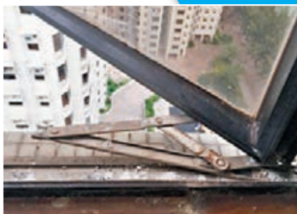
■窗鉸生鏽拉釘氧化嚴重折斷(上圖)，更換不鏽鋼材質(右圖)可以使用15年至20年。

另外，窗鉸要定期保養，以確保窗戶開關暢順，每半年就應用清水清潔窗鉸及鉸槽，抹去沙塵，亦宜在鉸位添加潤滑油。值得注意的是，不可以使用含腐蝕性的清潔劑及潤滑油，否則會令拉釘及窗鉸氧化生鏽。